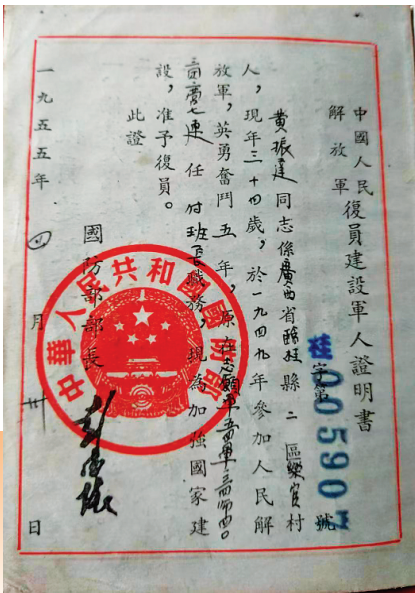
▲黄振达 1955 年的复员军人证明书。（大境瑶族乡政府供图）