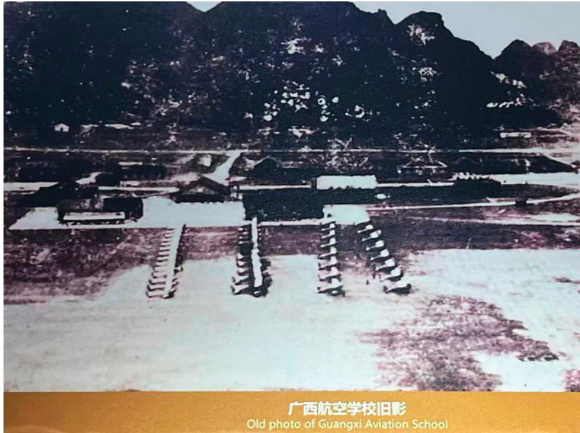
▲广西航空学校旧影。