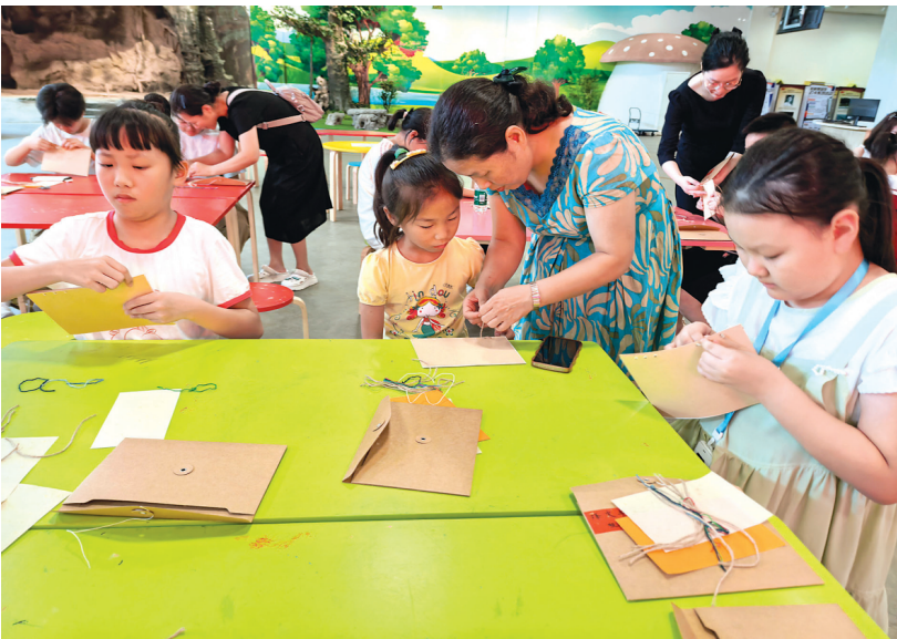
▲桂林博物馆举办 4 期抗战文化红色主题研学营吸引了近千名青少年前来学习与体验。图为孩子们正在动手制作桂林抗战标语笔记本。

桂林博物馆相关负责人表示，研学营活动带领广大青少年深入了解桂林抗战历史文化，激发了他们的爱国情怀，实现了“抗战文化 思政育人”的目标，得到了家长的一致好评。接下来，桂林博物馆将继续利用好丰富馆藏资源，不断创新活动形式，开展更多有意义的研学活动，为青少年提供滋养精神的红色土壤。