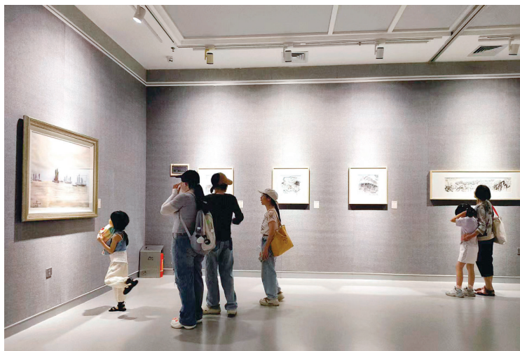
▲“甲天下——桂林、苏州山水题材作品展”吸引了众多市民游客前来观展。

本报讯（记者韦莎妮娜 通讯员吴萃薇）当婉约的江南水乡遇上灵动的桂林山水，会擦出什么样的火花？近日，“甲天下——桂林、苏州山水题材作品展”在桂林美术馆拉开帷幕。展览由桂林市文化广电和旅游局和苏州市文化广电和旅游局共同主办，桂林美术馆和苏州美术馆共同承办。