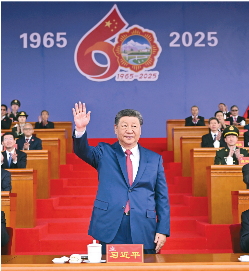
▲ 8 月 21 日上午,西藏各族各界干部群众约 2 万人欢聚拉萨市布达拉宫广场,热烈庆祝西藏自治区成立 60 周年。中共中央总书记、国家主席、中央军委主席习近平出席庆祝大会。