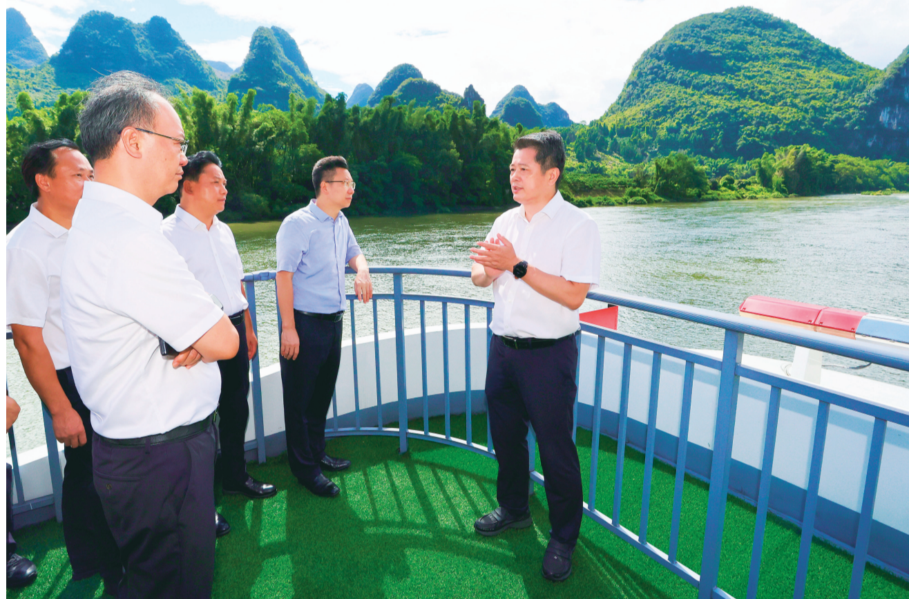
▲8月19日,市委书记李楚率队实地调研漓江流域生态环境保护工作。

李楚强调,全市各级各部门要牢固树立“绿水青山就是金山银山”的理念,强化政治担当、历史担当、责任担当,切实把保护好漓江、保护好桂林山水作为第一位的政治责任和底线要求,以眼里容不得沙子的最坚决态度,守护好山清水秀的自然生态。要坚持问题导向、注重标本兼治,以更高标准、更严要求、更实措施,尽快实现漓江支流“清劣返清”,加快补齐生态环境基础