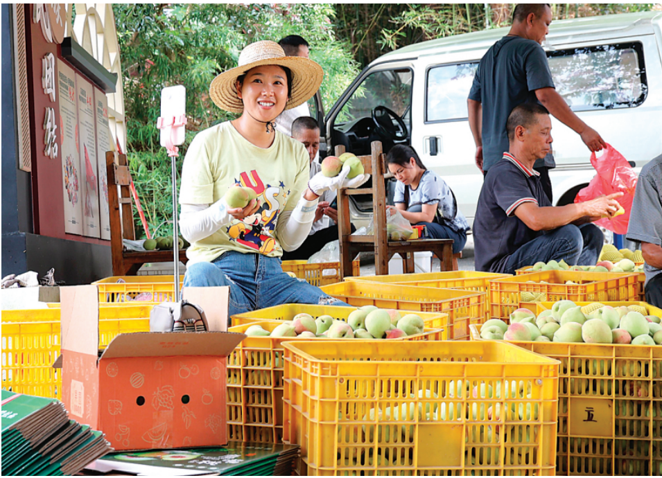
▲在羊咀村的鹰嘴桃种植基地，电商直播推介和销售正在进行。

采访中，记者看到，不少游客慕名前来羊咀村体验休闲采摘鹰嘴桃的乐趣。“我们今天特意开车过来品尝羊咀村的鹰嘴桃，真的特别脆、特别甜。”来自广州的游客赖玉容说，在品尝鹰嘴桃之余，桃园依山傍水的生态环境和周边网红打卡点，以及羊咀农产品展示厅内销售的桃胶等系列深加工产品，都成为他们驻足游玩的理由。