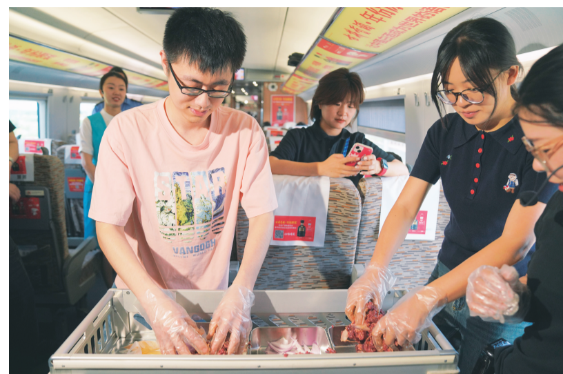
▲6月18日，一名旅客（左）在D6993次动车组列车上体验拌制齐齐哈尔烤肉。

当日，在由哈尔滨西开往齐齐哈尔的D6993次动车组列车上，中国铁路哈尔滨局集团有限公司联合黑龙江省文旅部门，开展齐齐哈尔烤肉美食文化体验活动。东北特色餐饮产品进入高铁列车，让游客在旅途中打开味蕾，感受齐齐哈尔烤肉独特的风味。