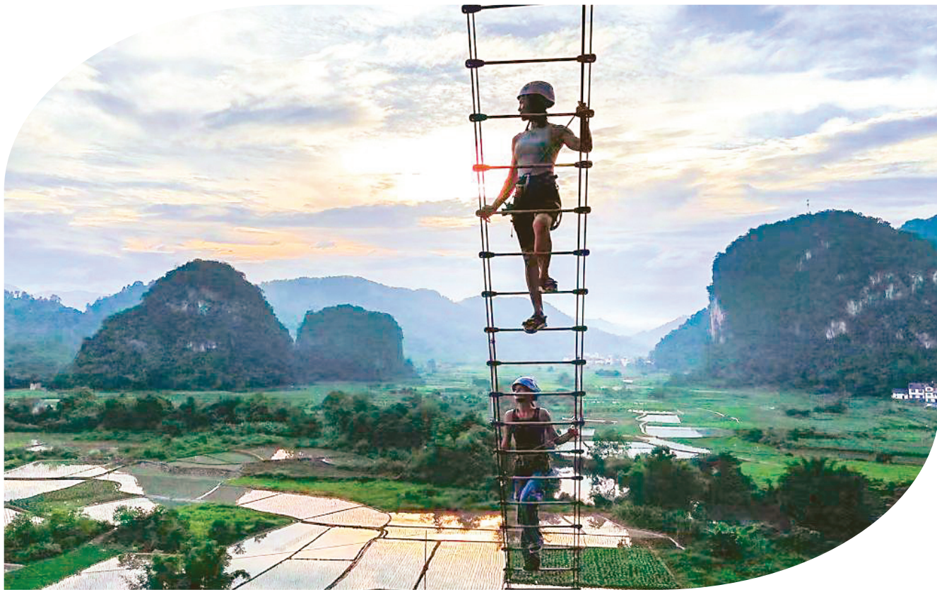
▲游客在桂林体验飞拉达。