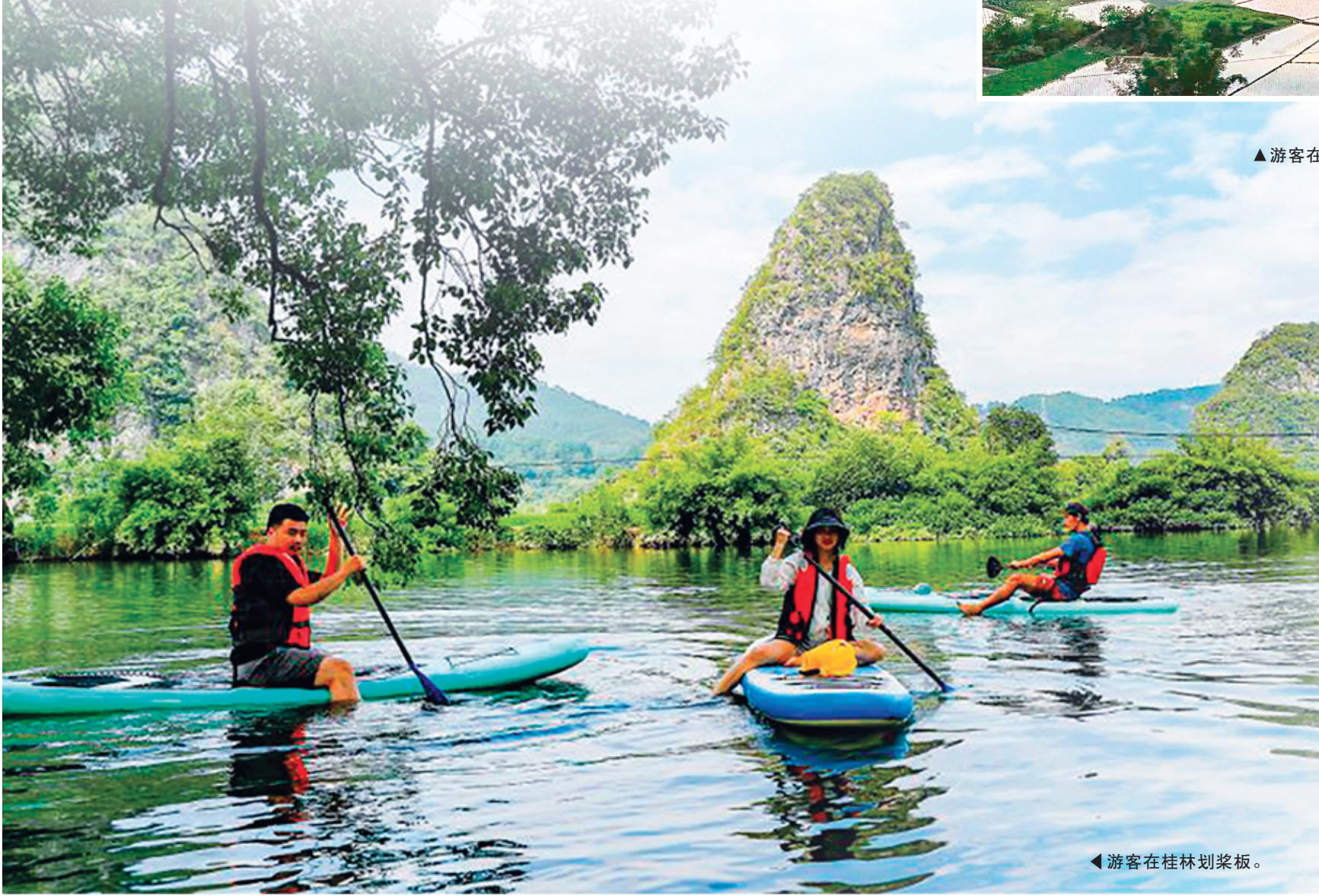
◀游客在桂林划桨板。