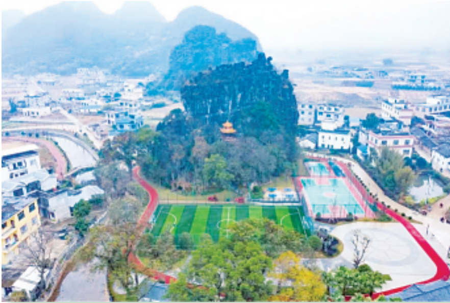
▼市民在体育公园足球场内练球。