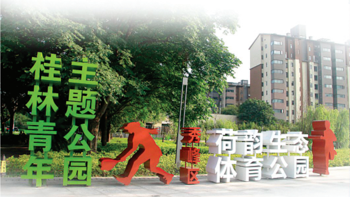
▲秀峰区荷韵生态体育公园位于桂林老城区与临桂新区衔接的琴潭片区内，辐射周边多个小区 8 万多居民。