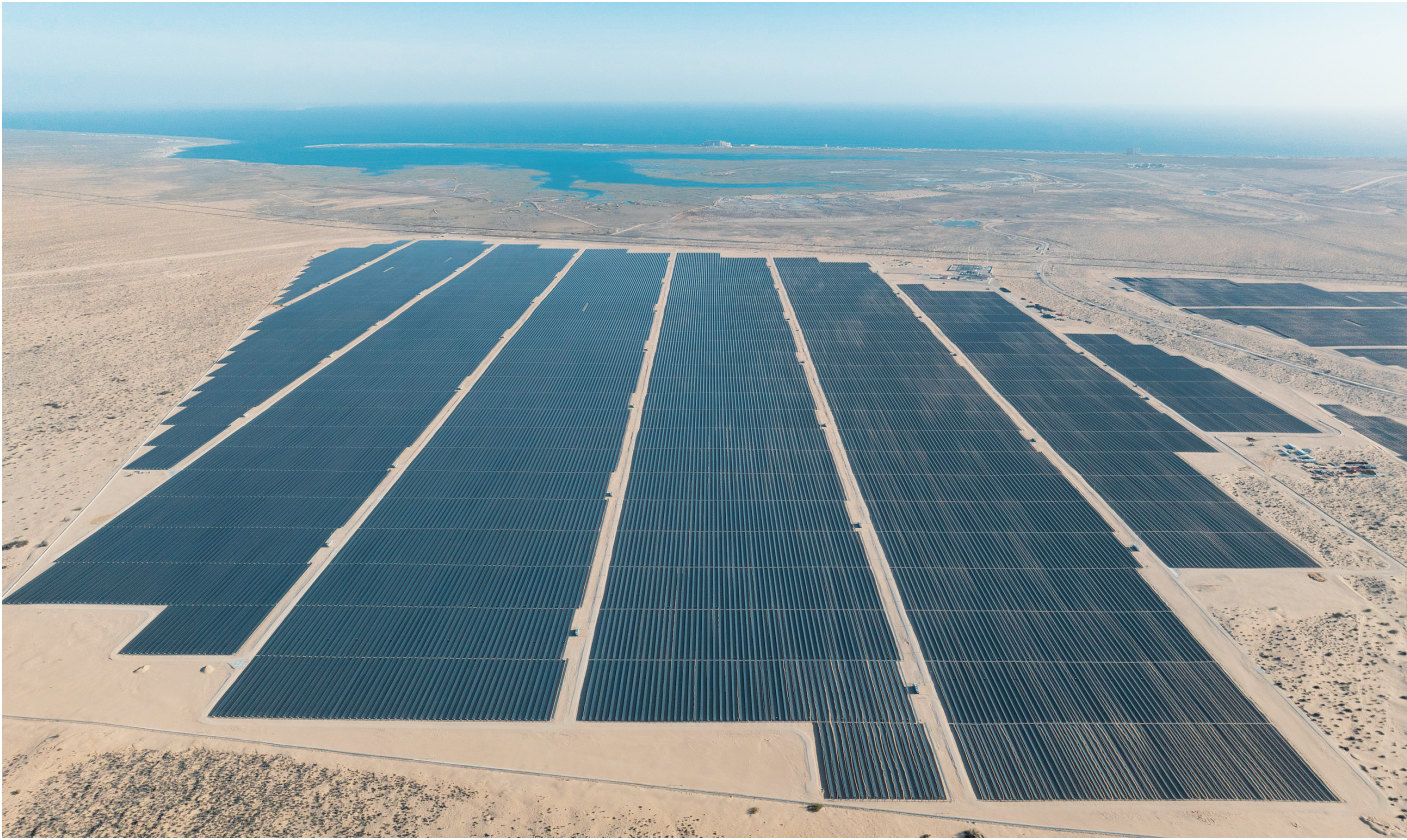
▲这是 2025 年 4 月 2 日在墨西哥佩尼亚斯科港附近拍摄的中国能源建设集团承建 的佩尼亚斯科港光伏项目二期工程（无人机照片）。

毛里塔尼亚环境与可持续发展部长马苏达·巴哈姆·穆罕默德·拉格达夫接受新华社记者采访时说，习近平主席提出的“绿水