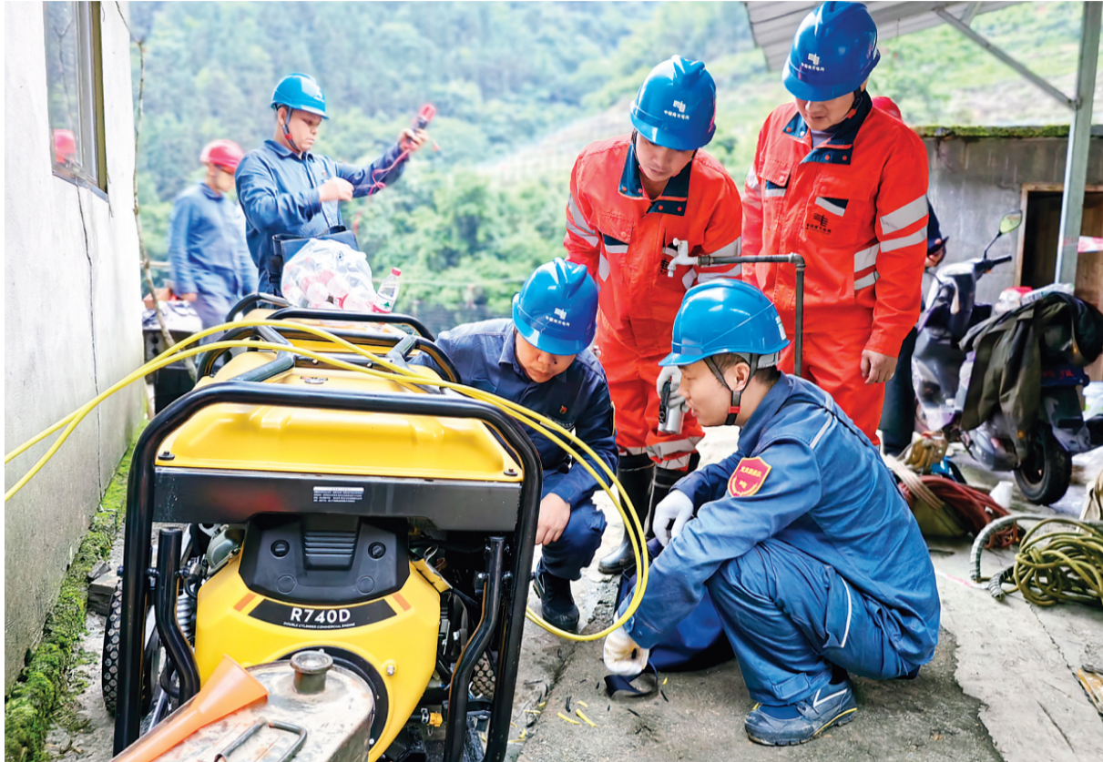
▲供电抢修人员向受灾区域紧急运送应急发电设备，保障群众生活用电。

连日来，市自来水有限公司在认真总结2024年防汛工作经验教训的基础上，对防汛应急预案进行了全面修订，