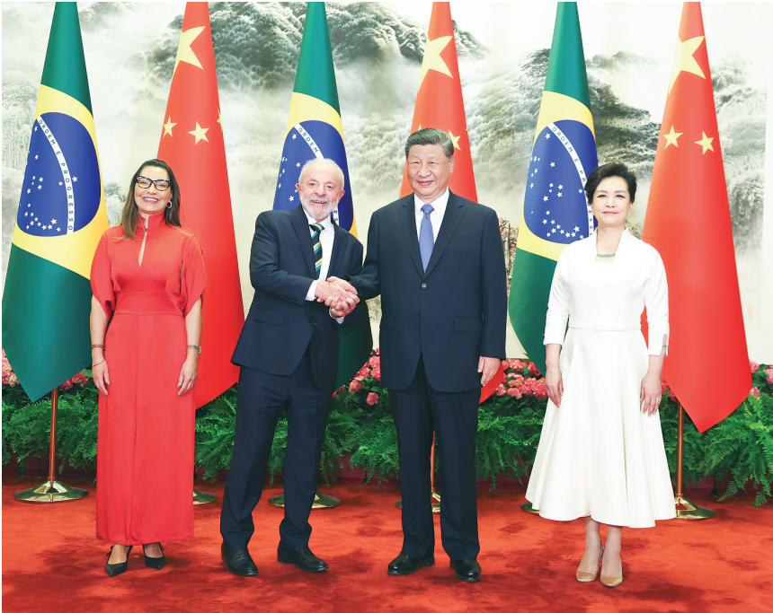
▲ 5 月 13 日下午，国家主席习近平在北京人民大会堂同来华进行国事访问的巴西总统卢拉举行会谈。这是习近平和夫人彭丽媛同卢拉和夫人罗桑热拉合影。

习近平强调，站在新的历史起点，中巴双方一要坚持战略互信，夯实中巴命运共同体根基，秉持相互尊重、互利共赢的优良传统，在涉及对方核心利益和重大关切问题上相互支持，加强各层级、全方位往来，确保双边关系长期健康稳定发展。二要坚持扩大合作，丰富中巴命运共同体内涵，深化“一带一路”倡议同巴西发展战略有效对接，发挥好两国各项合作机制作用，加强基础设施、农业、能源等传统领域合作，拓展能源转型、航空航天、数字经济、人工智能等合作新疆域，为两国务实合作打造更多亮点。三要坚持人文交流，增加中巴命运共同体活力，以明年举办“中巴文化年”为契机，加强文化、教育、旅游、媒体、地方等合作，为双方人员往来提供更多便利。四要坚