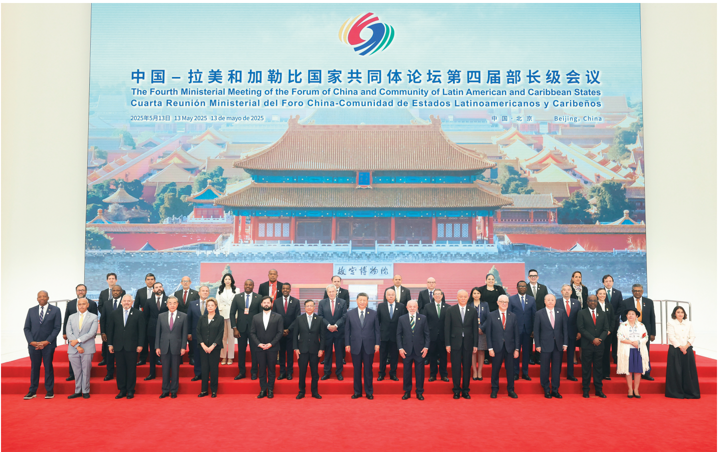
▲ 5 月 13 日上午,国家主席习近平在北京国家会议中心出席中国—拉美和加勒比国家共同体论坛第四届部长级会议开幕式并发表主旨讲话。