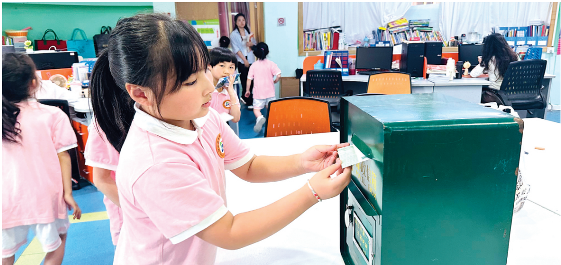
▲拔萃环球书院学生将承载心意的明信片投进邮筒。为确保心意及时送达，桂林邮政特别开通“母亲节专递通道”。

本报讯（记者黄敏 通讯员梁雪清 唐素萍 文/摄）在母亲节来临之际，中国邮政集团有限公司桂林市城区分公司创新文化传播形式，走进桂林拔萃环球书院，开展“巧思天工——中国古代重要科技发明创造”主题纪念封邮展暨母亲节感恩活动，为师生们带来一节融合科技、文化与温情的特色课堂。