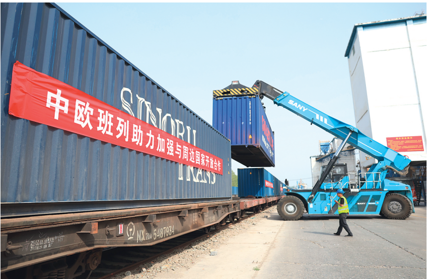
▲ 4 月 16 日，在北京 2025 年首趟中欧班列（北京—莫斯科）发车前，起重机吊装集装箱。当日，一列满载空调、防水卷材、轮胎等货物的中欧班列从中国铁路北京局北京铁路物流中心琉璃河营业网点专用线缓缓驶出，驶向俄罗斯首都莫斯科，标志着今年首趟北京至莫斯科中欧班列顺利开行。据介绍，本次班列将从满洲里口岸出境，一路向西驶向莫斯科，全程约 9000 公里，预计运输时间 16 天。