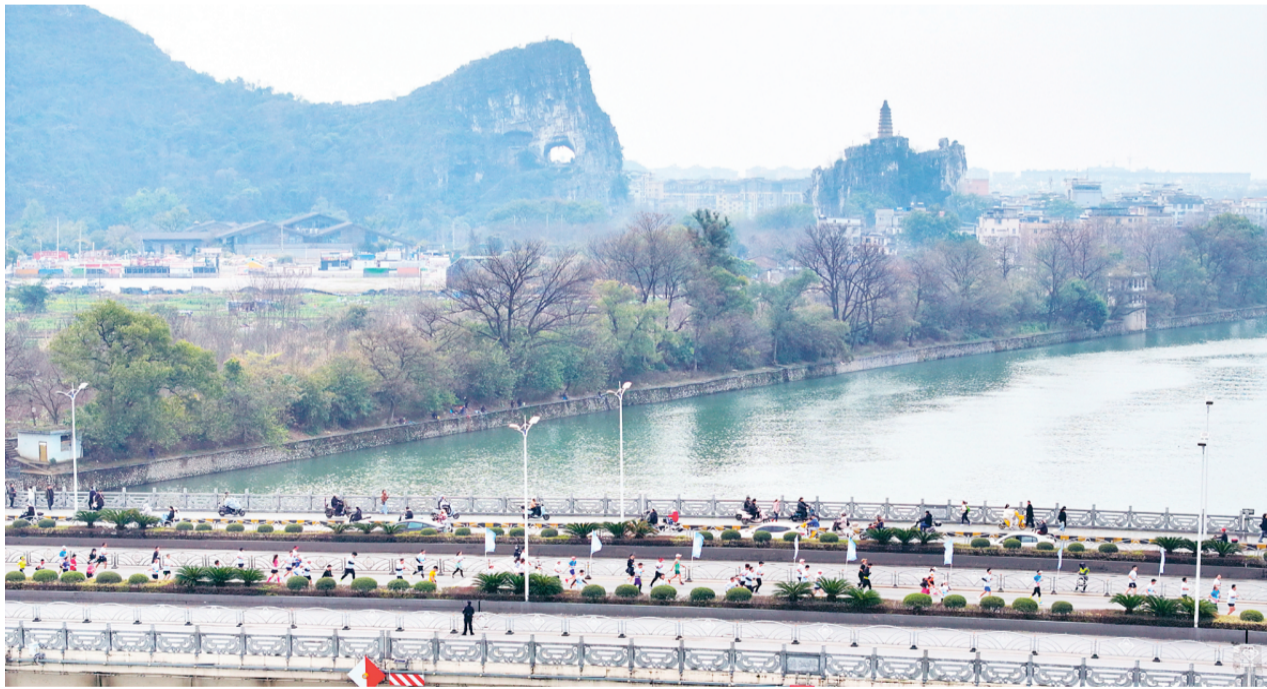
▲ 3 月 16 日, 2025 桂林半程马拉松在美丽山水间举行。图为选手们从漓江桥上跑过, 远处是桂林经典地标穿山和塔山, 感受“人在画中跑”的绝妙体验。