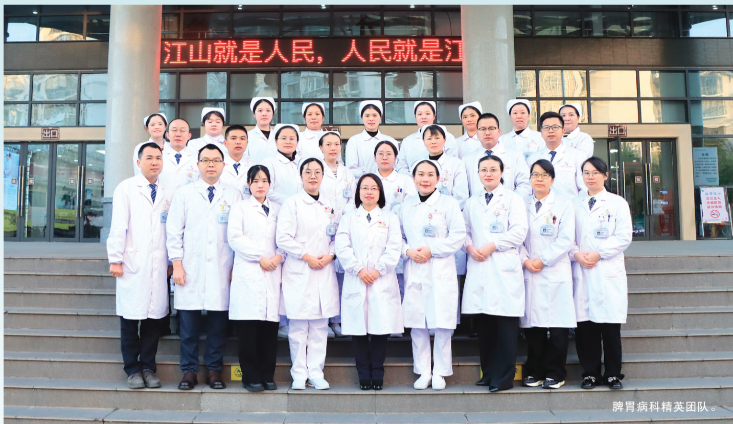
脾胃病科精英团队。