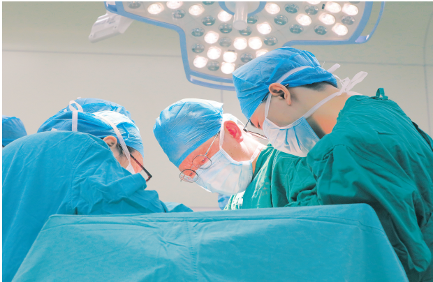
▲医疗团队在为患者做手术。