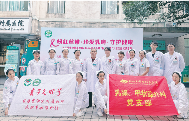
▲桂医附院乳腺甲状腺外科党支部开展党建活动。

在提升院前急救服务能力方面，医院优化了院前急诊服务流程，提升了 120 呼叫定位精度和反应速度，并制定急诊和转诊管理规定。2024 年，医院新增 10 辆救护车，对外设有广西卫生应急救援队伍，对内设有快速反应小组，为院内外应急抢救提供了强有力的保障。作为危重孕产妇救治中心、危重新生儿救治中心、胸痛中心、卒中中心、创伤中心，医院制定《重症患者收治