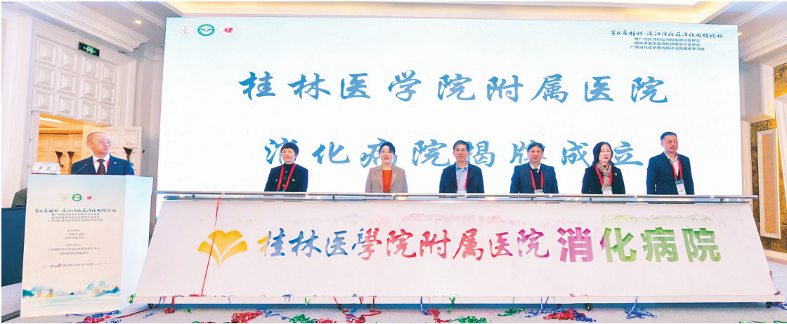
◀桂林医学院附属医院消化病院成立。

协调管理制度》，确保各科室收治流程顺畅，为急诊急救提供高效服务。对于急危重症患者，医院依照先诊疗后付费的原则开通绿色通道，2024 年急诊抢救 2548 人次，为 500 多名卒中、胸痛、创伤患者开通了绿色通道。