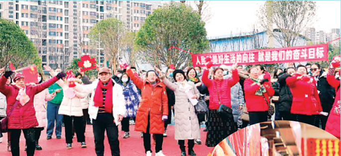
▲叠彩区永彩路的“口袋公园”内，不少市民在此休闲娱乐，很是热闹。