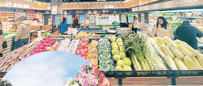
▲桂林力源粮油食品集团推出的生鲜超市。