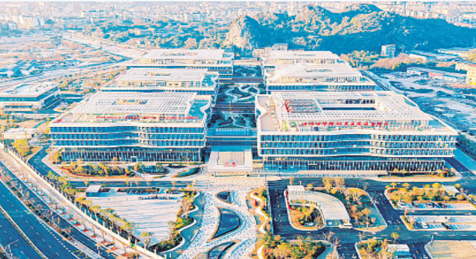
▲桂林医学院附属医院漓东院区。