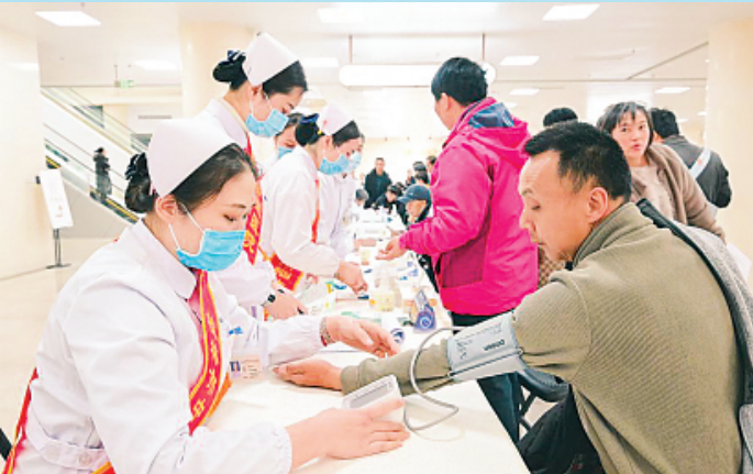
▲桂林市中医医院城北院区的门诊于1月18日上午正式启用。