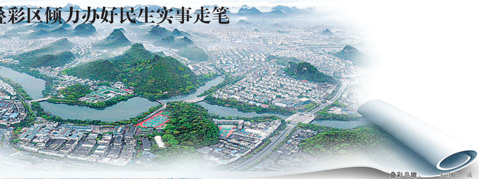
叠彩鸟瞰。