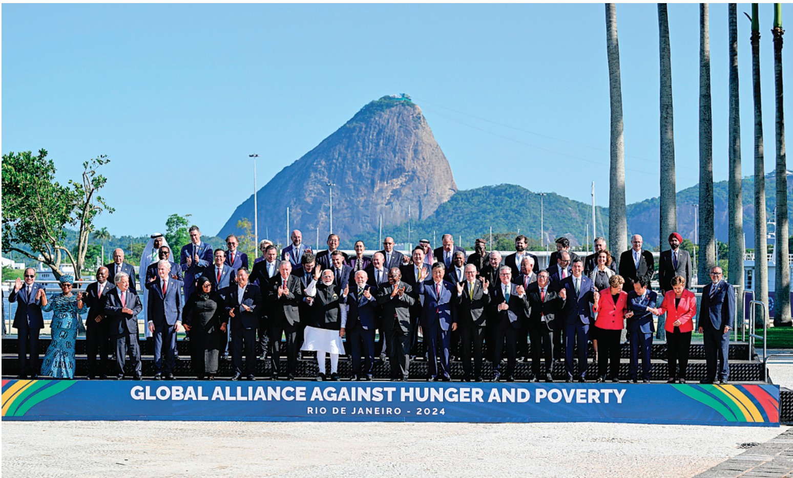
▲当地时间 11 月 18 日上午，国家主席习近平在巴西里约热内卢出席二十国集团领导人第十九次峰会。峰会把“构建公正的世界和可持续的星球”作为主题，并决定成立“抗击饥饿与贫困全球联盟”。这是习近平同与会领导人共同参加巴方发起的“抗击饥饿与贫困全球联盟”合影。