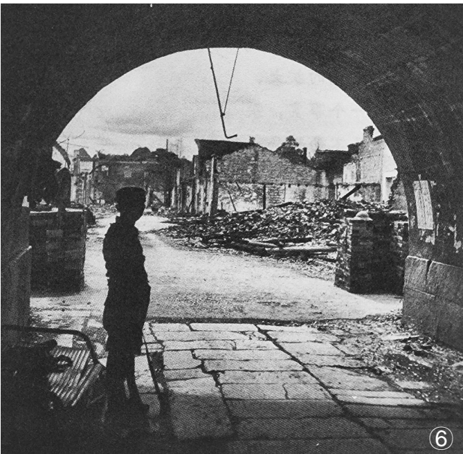
图①：桂林保卫战之前的漓江。 图②：战后的桂林城满目疮痍。 图③：中国军队收复桂林后的十字街，一名士兵在此站岗。 图④：桂林保卫战之前的桂林热闹繁华，大街上行人如织。 图⑤：战前桂林组织大疏散，图为火车站内人们赶火车的景象。 图⑥：战后的王城东华门。