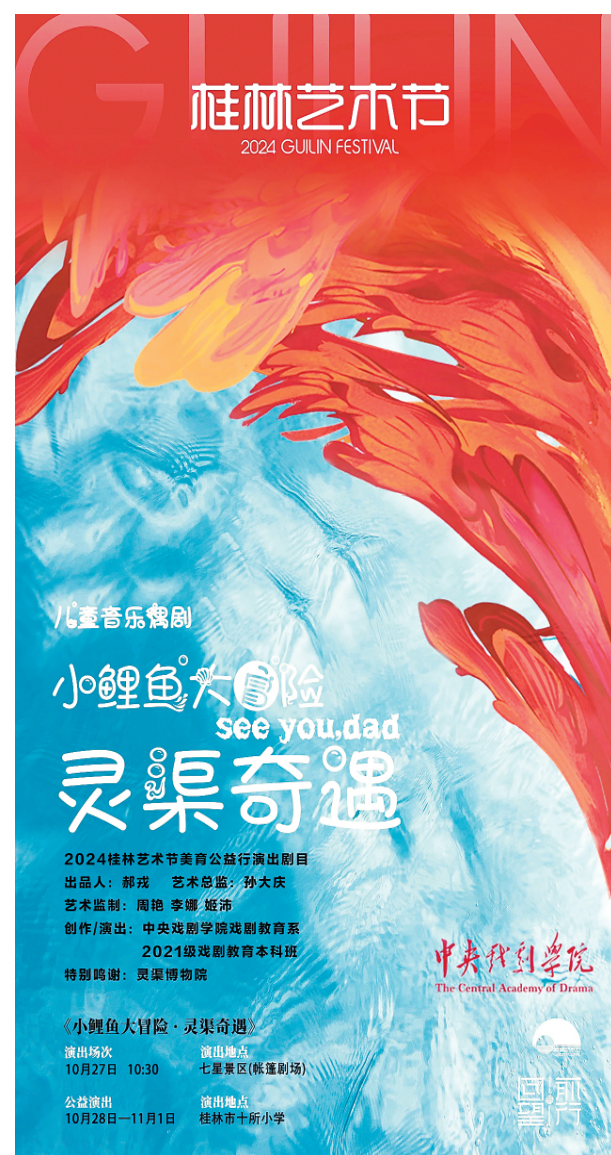
▲儿童音乐偶剧《小鲤鱼大冒险·灵渠奇遇》海报