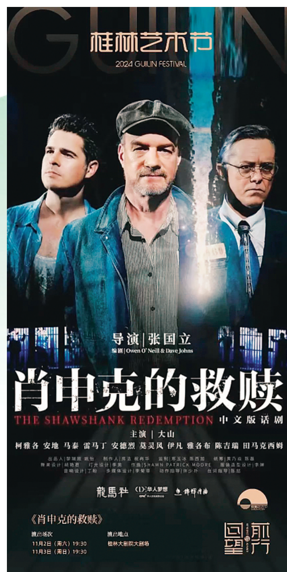
▲中文版话剧《肖申克的救赎》海报