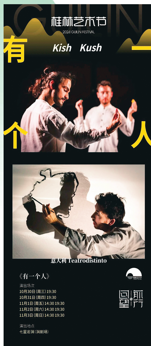
▲意大利肢体影子戏剧《有一个人》海报