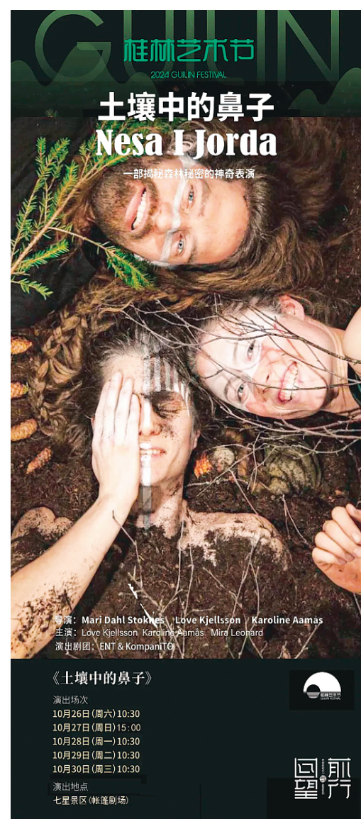
▲《土壤中的鼻子》海报