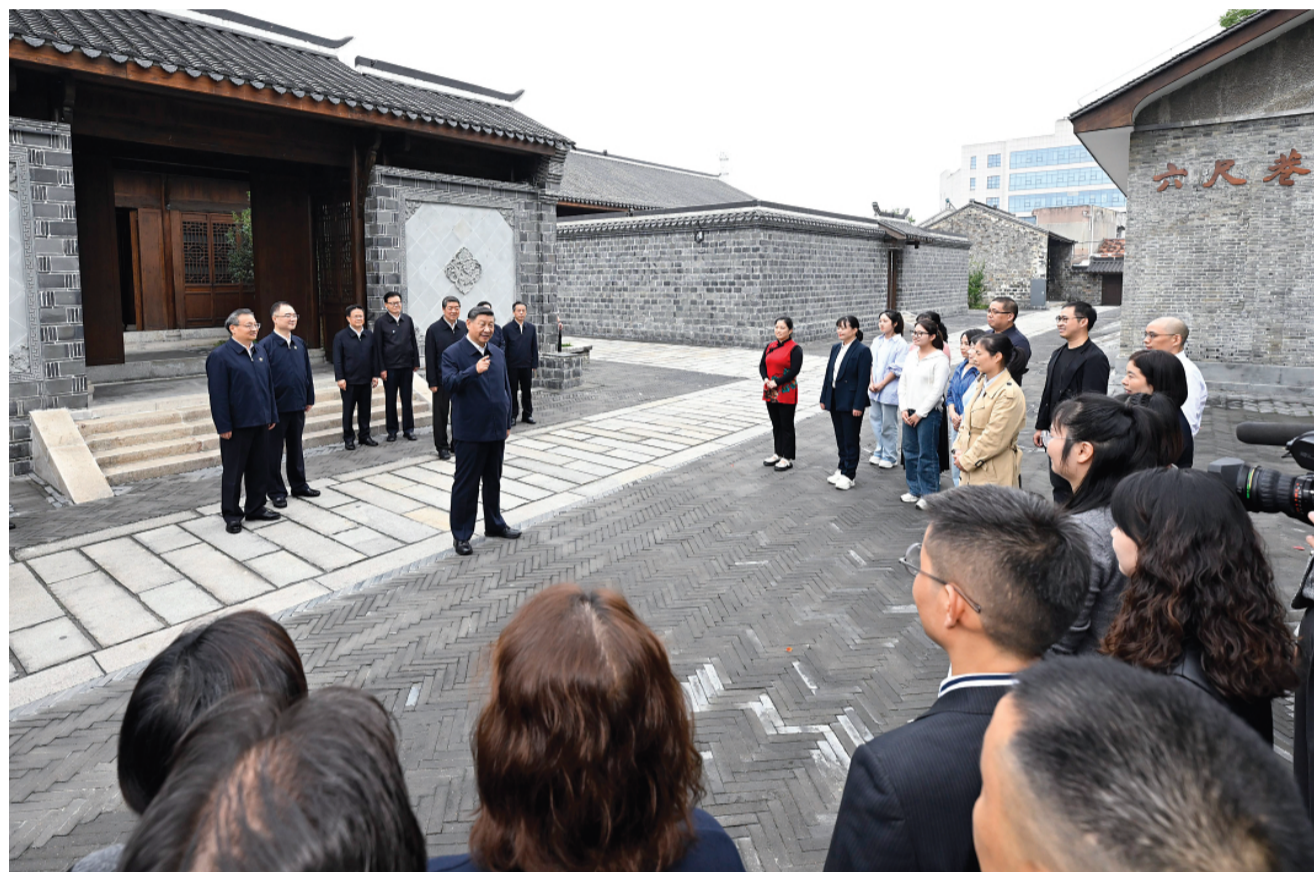
▲ 10 月 17 日至 18 日,中共中央总书记、国家主席、中央军委主席习近平在安徽考察。这是 17 日下午,习近平在安庆桐城市六尺巷考察时,同当地居民和游客亲切交流。