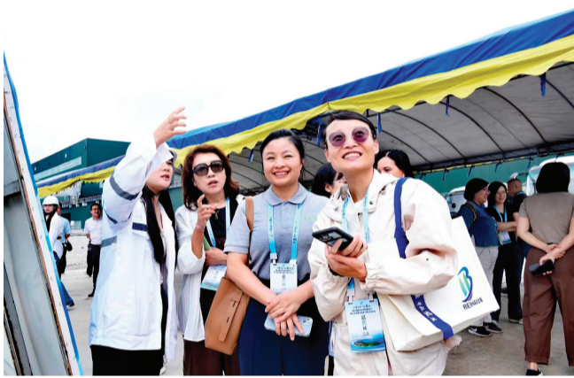
▲ 采访团在广西蓝海海洋工程有限公司调研采访。