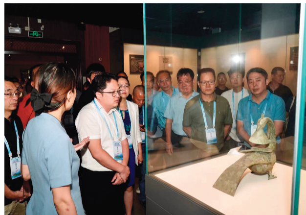
▲ 采访团在合浦汉代文化博物馆参观。