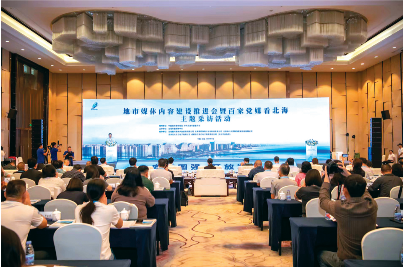
▲ 9月24日，由中国地市报研究会、中共北海市委宣传部指导，北海市融媒体中心主办的地市级媒体内容建设推进会暨百家党媒看北海主题采访活动在北海市启动。

——地市媒体内容建设推进会暨“向海图强 开放发展”百家党媒看北海主题采访活动侧记