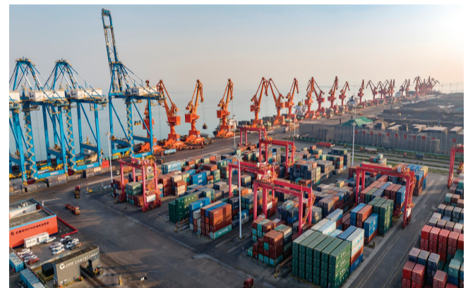
▲ 繁忙的铁山港公用码头。