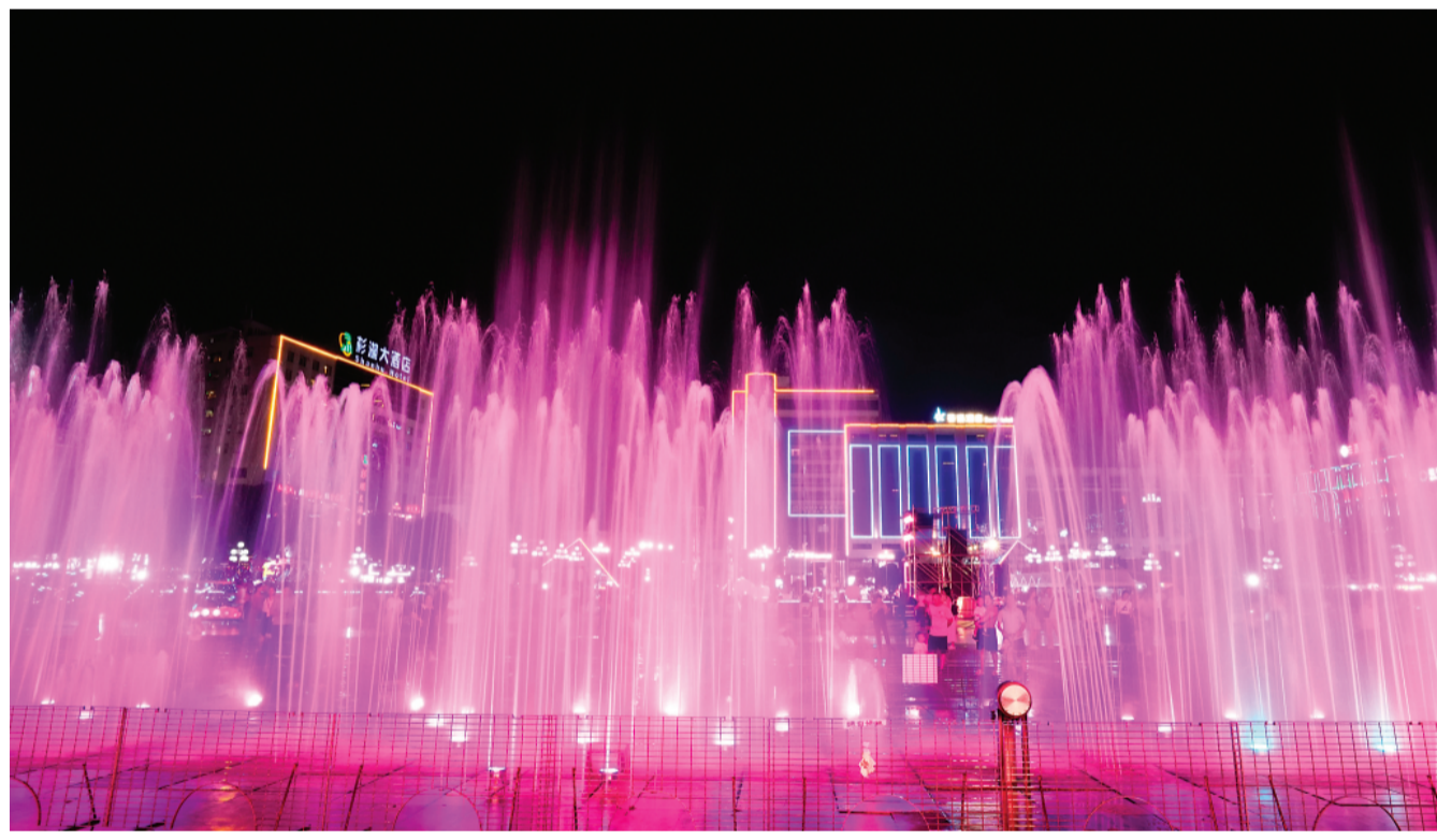
▲9月29日晚上7点半，市中心广场舞台前的旱地喷泉伴随着灯光和音乐缓缓喷涌而出，犹如一群曼妙的精灵舞者，摇曳多姿，引得市民感叹“好久不见”。

2021年，桂林步入打造世界级旅游城市新征程。中心广场作为桂林的“城市会客厅”，在为市民及游客提供休闲娱乐场地的同时，也应当展现出与世界级旅游城市相匹配的高品质、国际范。而音乐喷泉作为重要公益项目，有利于提升中心广场的人气 and 整体形象。为此，桂林嘉信国际集团有限公司着眼大局，响应市民心声，积极筹备音乐喷泉的恢复表演事宜。2024年恰逢新中国75周年华诞，音乐喷泉的恢复工作被提上日程。面对经费紧张的情况，公司积极展现国企担当，通过自筹资金对喷泉基础设施进行清理、修复，并更新和提升了控制系统、音响系统等。经过几个月的努力，硬件设施的修复工作