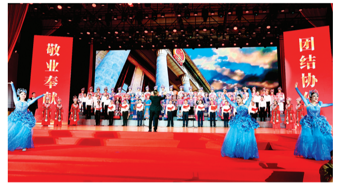
▲9月29日晚，桂林理工大学“歌唱我们伟大的祖国”——庆祝中华人民共和国成立75周年大型艺术思政课在该校盛大上演，师生代表共3000余人现场观看演出。

此外，资江·天门山景区、猫儿山景区、灵渠景区、大碧头国际旅游度假区等也推出了诚意满满的节日优惠，欢迎广大市民游客参观游览。