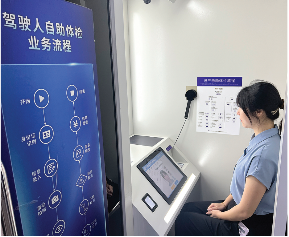
▲市公安局交警支队车管所业务大厅内，市民通过驾驶人自助体检拍照一体机进行体检。

“放管服”只有三个字，但对于公安交管服务来说却是“无止境”的。在优化营商环境和推进公安行政管理服务改革的大形势下，桂林市公安局交警支队将进一步释放公安“放管服”改革红利，不断创新服务模式、优化服务质量、着力解决群众“急难愁盼”问题，打造“升级版”的现代化车管服务体系，让群众感受高效便捷的交管服务。