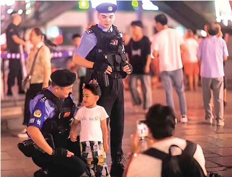
▲阳朔旅游警察在遇龙河国家级旅游度假区巡逻。