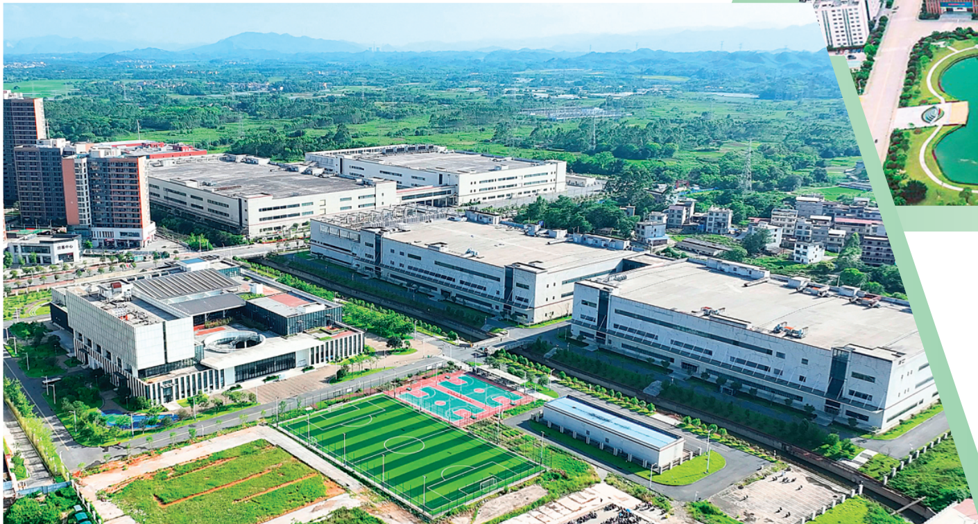
▲桂林深科技智能制造产业园是一个典型的花园式工厂。

上半年，全市规模以上工业总产值同比增长6.4%；规上工业增加值同比增长6.8%，比全国高0.8个百分点，增速较一季度提升6.1个百分点；高技术制造业增加值同比增长19.5%；装备制造业增加值同比增长23.4%，拉动全部规上工业增加值增长6.4个百分点；电子信息产业增加值同比增长30.0%……一组组数据涌动着工业加快振兴的澎湃活力，向上跃动的数字交出了制造业迈向高质量发展的靓丽“答卷”，谱写出桂林经济“龙腾虎跃”新篇章。