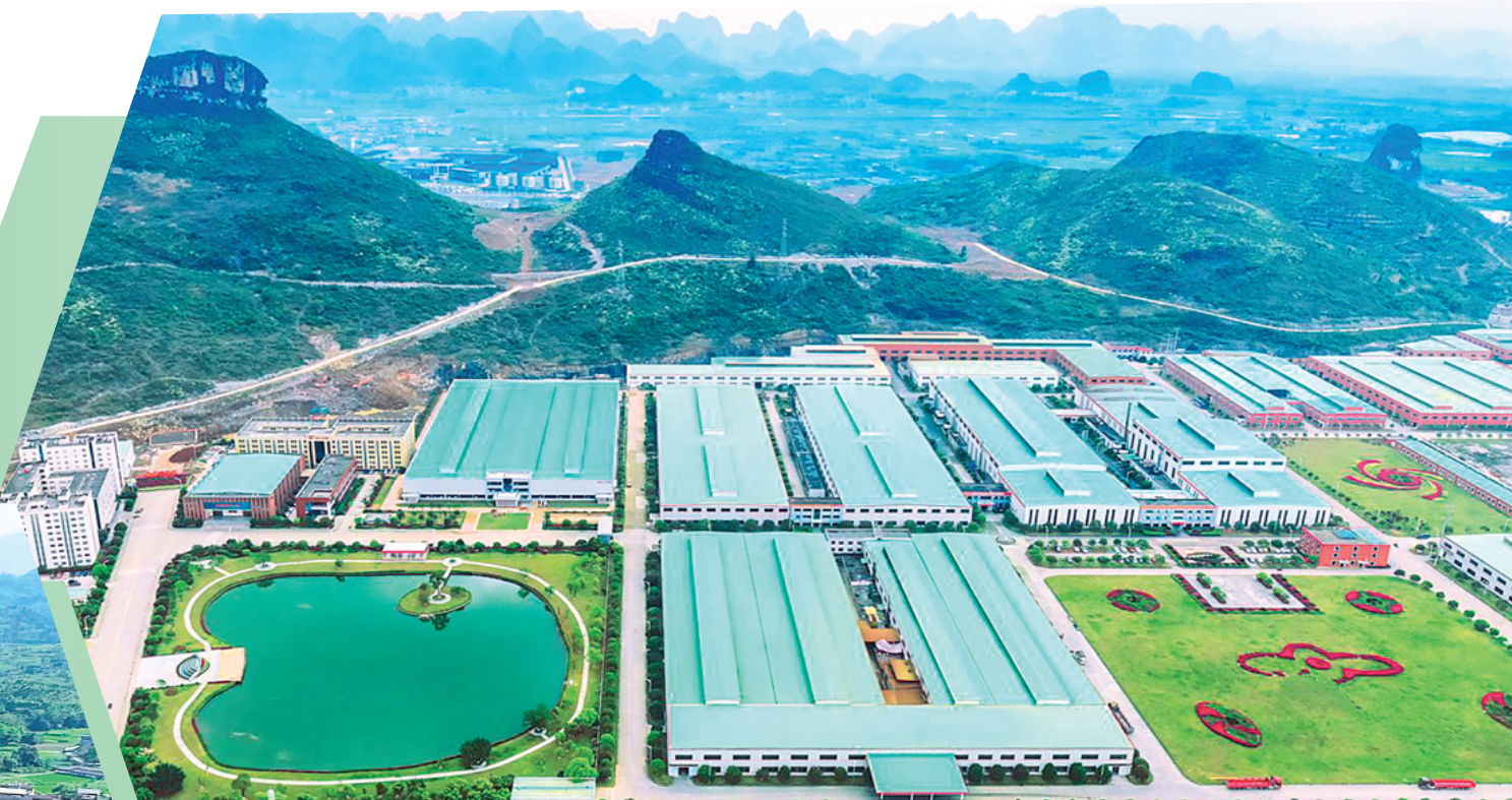
▲桂林福达股份有限公司生产厂区。

另据市科技局发布的数据，截至目前，全市国家级科技创新平台达78个，广西重点实验室数量达43个。