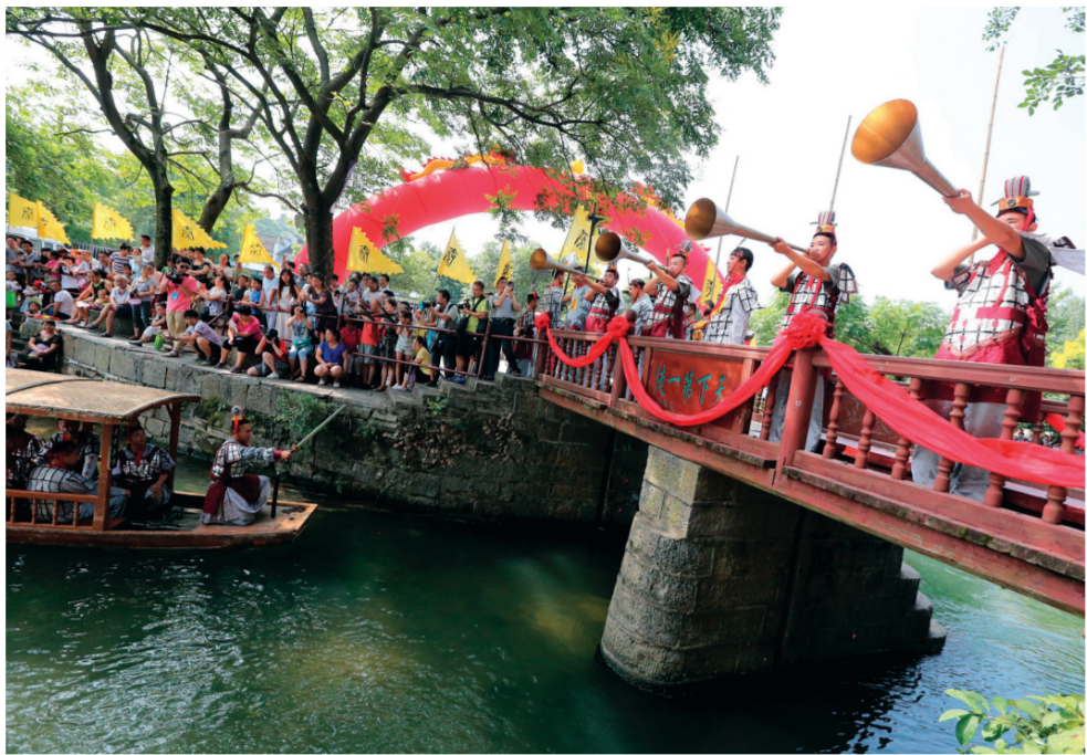
▲灵渠举行传统的开闸仪式，再现古灵渠的辉煌。

不仅如此，建筑学家们经过考察还发现，灵渠建设工程的工艺也极其细致精巧，精细到每一块石头的打磨，石头与石头之间石缝的填补，加上各朝历代对灵渠的精心维护，使得灵渠能够坚固屹立2000多年而不倒。