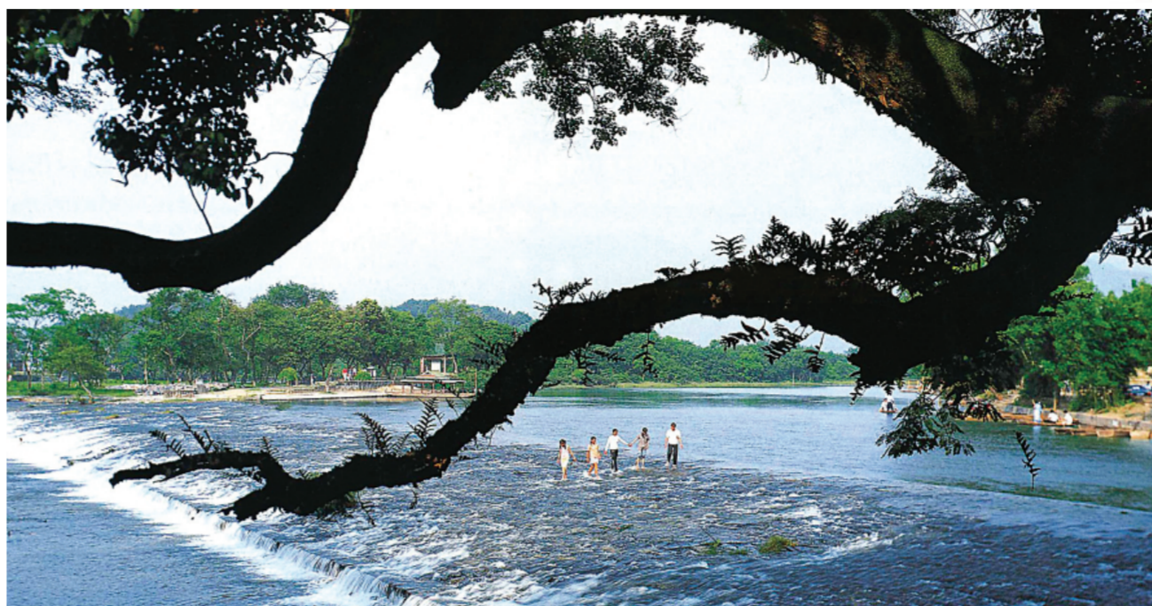
▲在古树的映衬下，灵渠更显出它的灵动和活力。