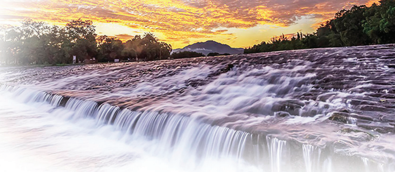
▲千年古渠，活力依旧。