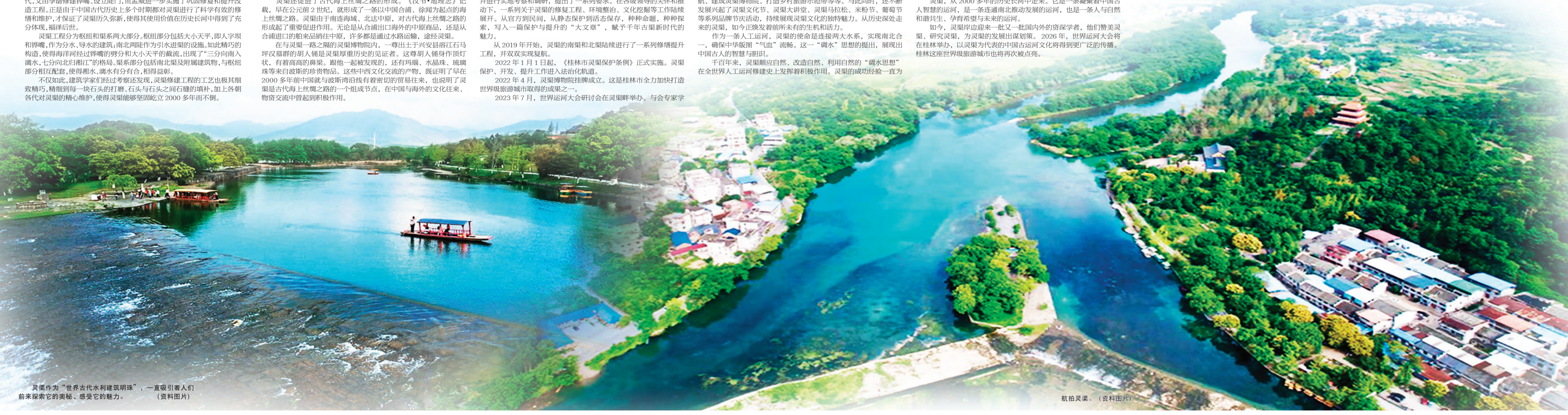
灵渠作为“世界古代水利建筑明珠”，一直吸引着人们前来探索它的神秘、感受它的魅力。（资料图片）