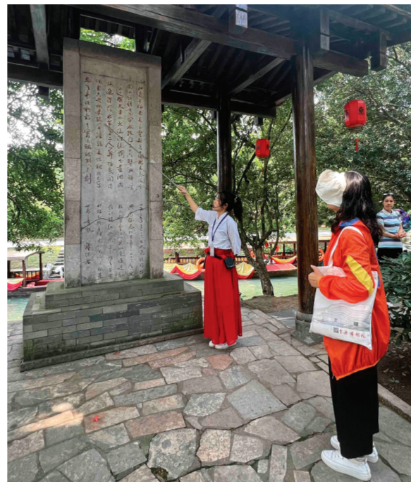
▲讲解员在向游客讲解郭沫若游览灵渠时写下的《漓江红·灵渠》。