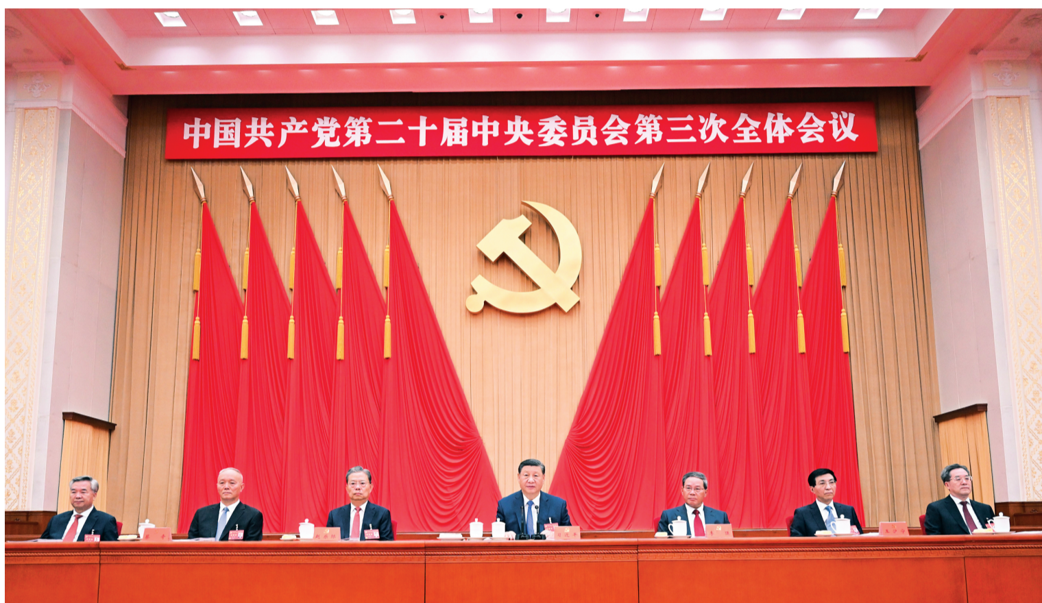
▲中国共产党第二十届中央委员会第三次全体会议,于2024年7月15日至18日在北京举行。这是习近平、李强、赵乐际、王沪宁、蔡奇、丁薛祥、李希等在主席台上。