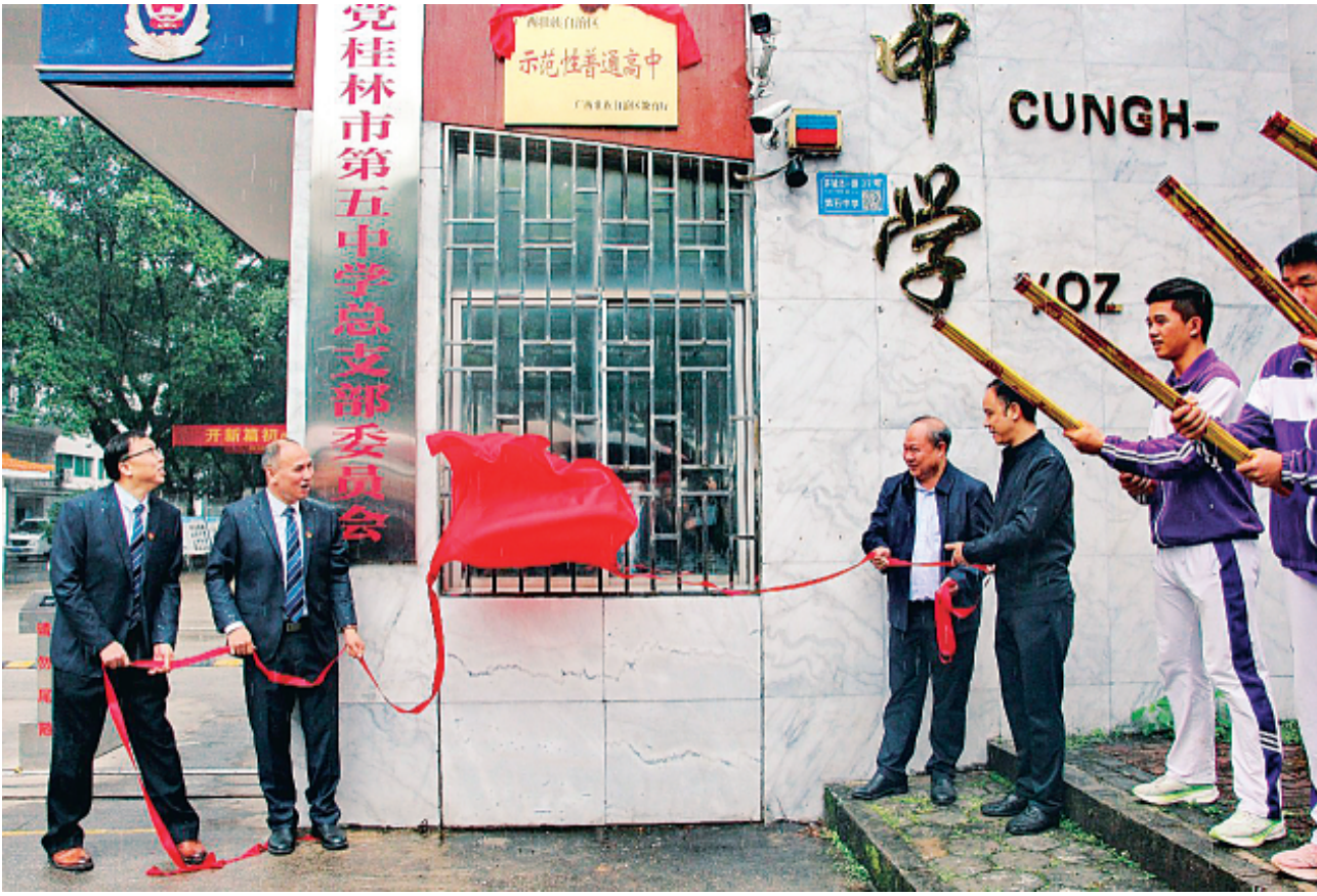
▲自治区示范性普通高中揭牌

学校领导班子学科结构、年龄结构合理，分工明确。学校领导名校长培养对象3人，桂林市学科带头人2人，桂林市特约教研员3人。学