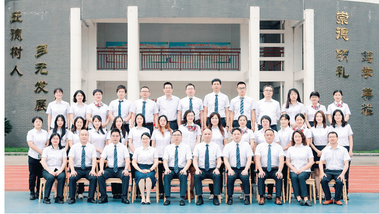
▲桂林市第五中学 2024 届教师团队

学校不断强化“科研兴校，科研强校”的意识，结合学校实际，营造科研氛围，促进教师课题研究意识，学校现阶段开展研究的课题有：广西普通高中基础教育教学改革质量提升项目1项，市级B类课题3个，C类课题1个，桂林市教育评价专项课题1项；心理健康专项课题2个，双减专项课题2个，智慧校园专项课题3个，家庭教育专项课题1个，个人课题2个，校级课题2个，共18个课题。荣获2021、2022年桂林市教育科研先进单位。