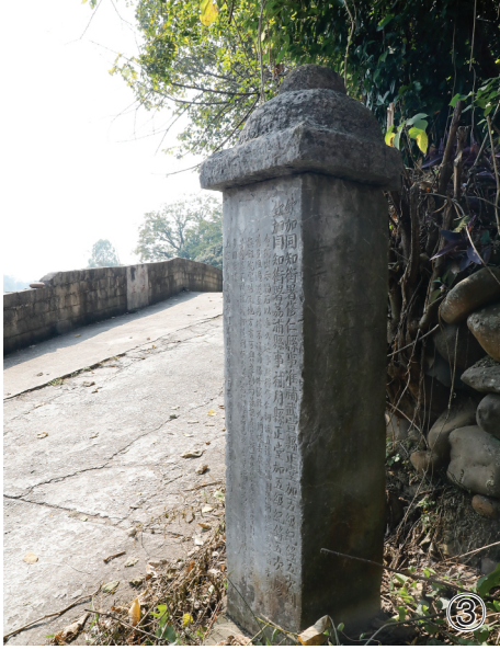
图①：修仁文庙。 图②：修仁文庙状元桥。 图③：修仁漕运码头的古石碑。