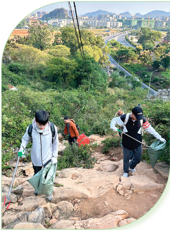
◀ 一位户外爱好者钻到灌木丛下捡垃圾。