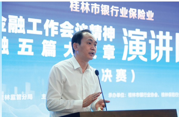
▲国家金融监督管理总局桂林监管分局党委书记龙宪泓致辞。