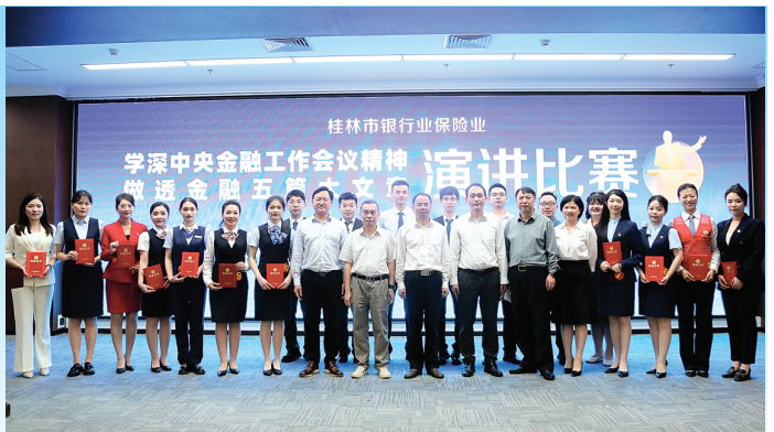
▲领导、嘉宾与参赛选手合影。

本报讯（记者徐莹波 通讯员赵瑜鑫）日前，桂林市银行业保险业“学深中央金融工作会议精神 做透金融五篇大文章”主题演讲比赛举行。本次比赛由国家金融监督管理总局桂林监管分局指导，市金融团工委主办，市银行业协会、桂林保险行业协会承办，广西桂林漓江农村合作银行协办。