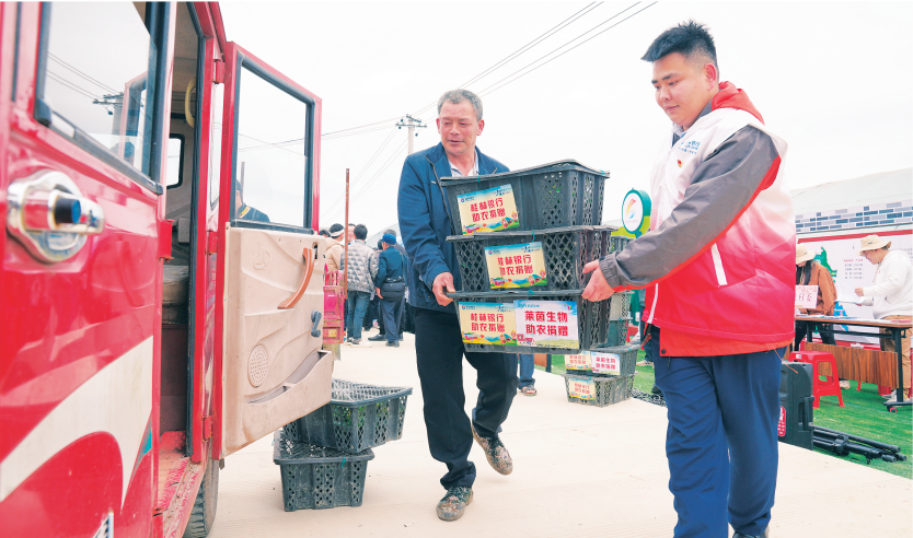
▲叠彩区上阳村委联合桂林银行慰问村里高龄老人。