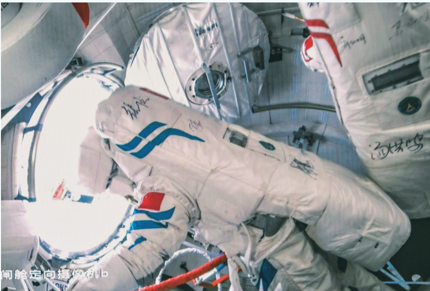
▲3 月 2 日，在北京航天飞行控制中心拍摄的神舟十七号航天员汤洪波（右）和江新林（左）在完成任务后返回舱内。