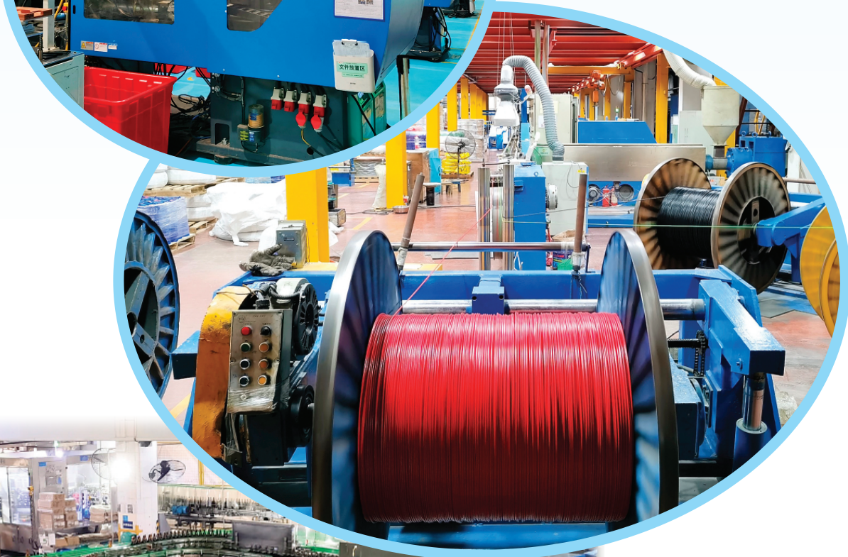
▲桂林国际电线电缆集团有限责任公司是我市装备制造业的代表性企业，图为该公司的120挤塑机正在生产加工线缆。