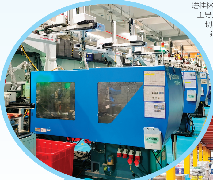
▲桂林领益制造有限公司是我市电子信息产业代表性企业，图为该企业的生产车间。

市工信局有关负责人表示，发展四大主导产业是推进桂林工业振兴的主要抓手。今年，工信部门将以四大主导产业中的前100强企业为重点，优化服务水平，切实解决企业难题。加强招商引资，促进项目落地建设和竣工投产，做大工业经济总量，助力各产业集群做强做大。