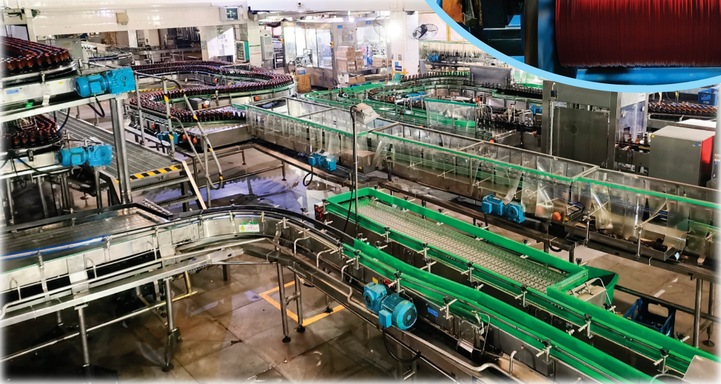
▲燕京啤酒（桂林漓泉）股份有限公司是我市生态食品产业代表性企业，图为该公司的全自动化生产线。