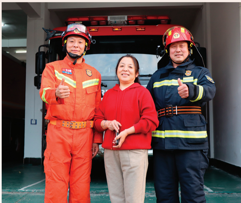
▲一家三口在站里合影。