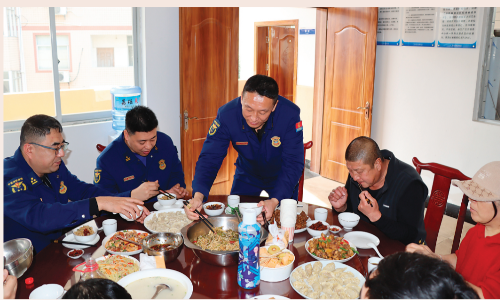
▲大家一起其乐融融地吃团圆饭。

为了使命和职责聚少离多，舍小家为大家……这场消防站里的特殊团圆活动，便是广大消防救援队员“对党忠诚、纪律严明、赴汤蹈火、竭诚为民”的真实写照。