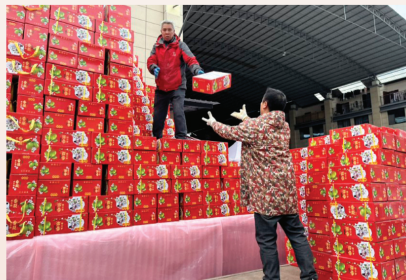
▲临近春节水果旺销，商家大量备货。

记者从桂林市商务局了解到，我市重点批发市场如福达农产品交易市场、五里店果蔬批发市场、汇东批发市场、桂林万禾市场等，针对春节消费已提前进行货物储备，无论肉品、蔬菜、海鲜、水果等都能满足市民需求。