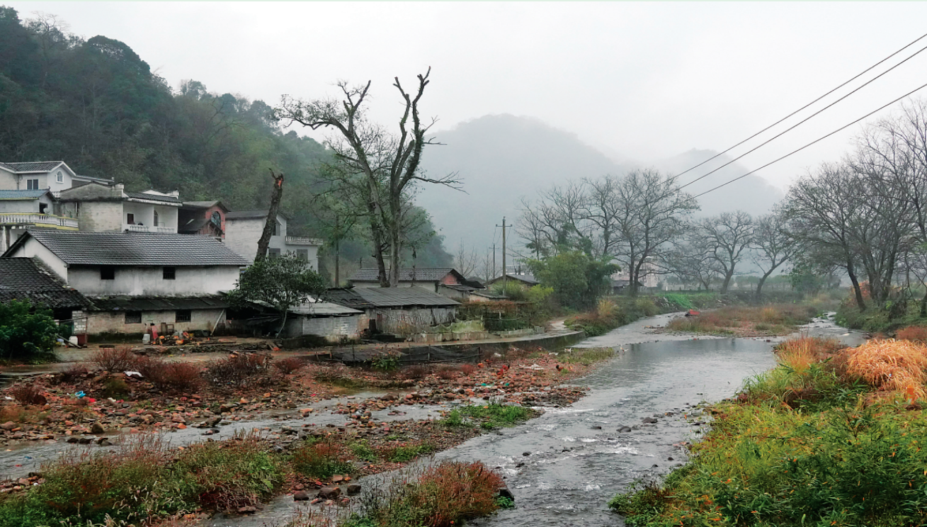
▲水滨村沿河民居一景