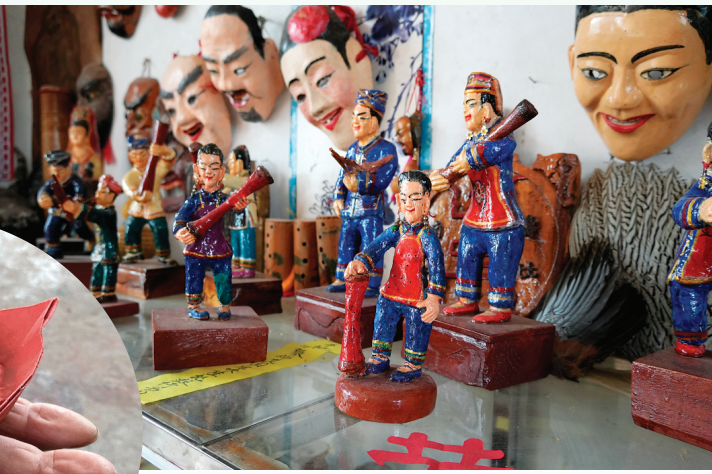
▲吹笙扯鼓舞的陶塑小人