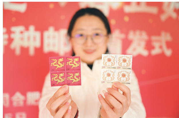
▲ 1 月 5 日，在《甲辰年》特种邮票合肥首发活动现场，中国邮政集团有限公司合肥市分公司工作人员展示《甲辰年》特种邮票。中国邮政 1 月 5 日发行《甲辰年》特种邮票。邮票一套两枚，分别名为“天龙行健”“辰龙献瑞”。