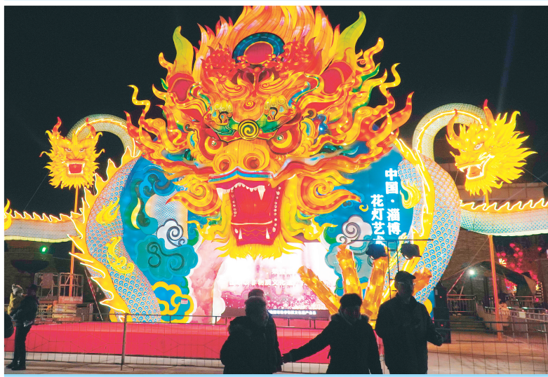
▲ 1 月 4 日，人们在 2024 年淄博玉黛湖花灯会上赏灯游览。近日，2024 年淄博玉黛湖花灯会在山东省淄博市张店区玉黛湖公园拉开帷幕。此次花灯会以“穿越千年 点亮盛世”为主题，共布置大型花灯 60 余组，将持续举办至 3 月 11 日。