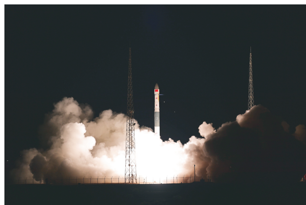
▲ 1 月 5 日 19 时 20 分，我国在酒泉卫星发射中心使用快舟一号甲运载火箭，成功将天目一号气象星座 15-18 星发射升空，卫星顺利进入预定轨道，发射任务获得圆满成功。