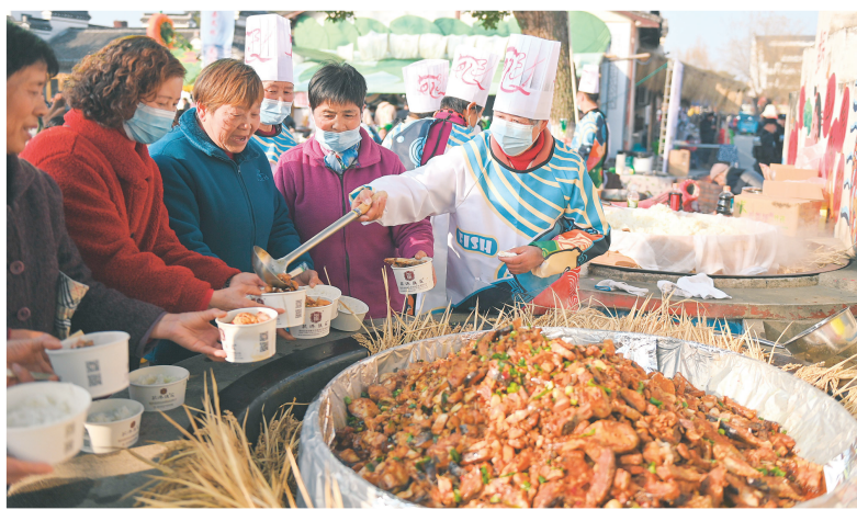
▲ 1 月 5 日，游人在和孚镇荻港村品尝当地特色的鱼汤饭。当日，浙江湖州南浔区鱼文化节在和孚镇荻港村开幕，游人赏民俗、品尝鱼汤饭，体验江南水乡丰收场景。一年一度的鱼文化节已成为当地展示桑基鱼塘文化遗产的重要节庆活动。