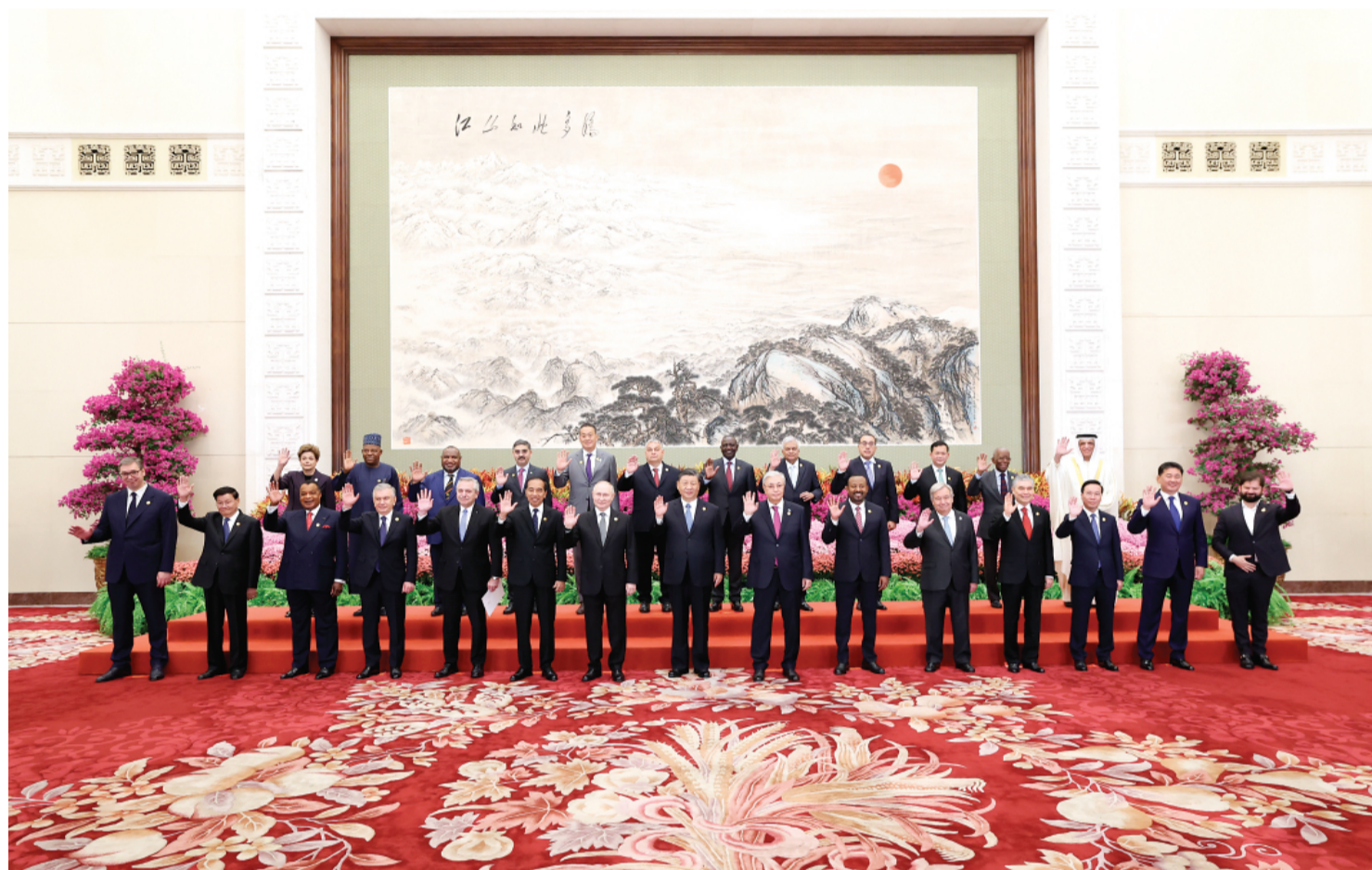
▲ 10 月 18 日上午, 国家主席习近平在北京人民大会堂出席第三届“一带一路”国际合作高峰论坛开幕式并发表题为《建设开放包容、互联互通、共同发展的世界》的主旨演讲。