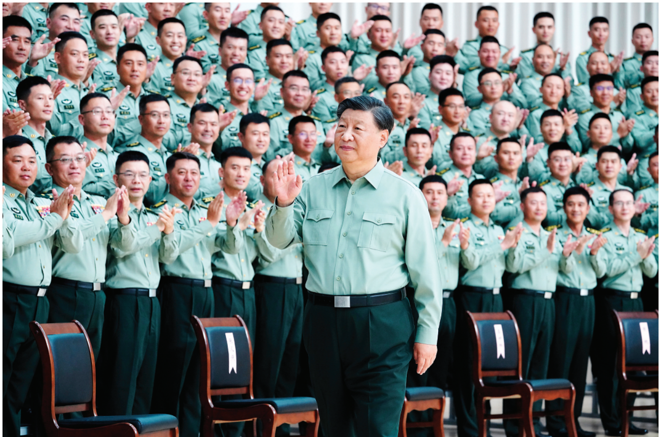
▲ 9 月 8 日,中共中央总书记、国家主席、中央军委主席习近平到 78 集团军视察。这是习近平亲切接见 78 集团军官兵代表。