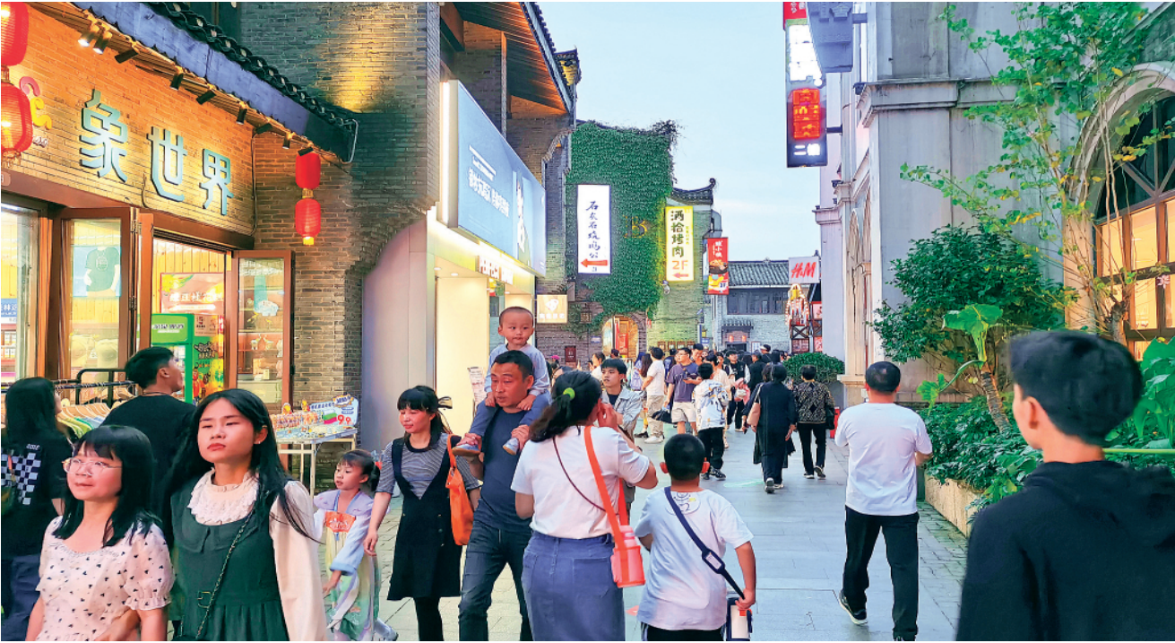
◀“五一”假期,游客在东西巷历史文化街区游览。

各大商贸企业抓准商机,线上线下相结合,积极开展促销活动,取得了良好成绩。如微笑堂开展了“浪漫婚庆季”主题活动,珠宝首饰柜、精品柜推出多款当季新品,叠加其他专柜的优惠活动,全方位的促销活动吸引了众多人流,让消费者尽享购物快乐;化妆品、婚庆用品销售额同比明显增长,人流量同比大幅增加。桂林百货大楼超市区推出全品类“爆款秒杀”活动,家电区推出“满1000返100”促销,百货区开展了女装尚新节、鞋履箱包节、婚庆床品节、绅士服饰节、运动防晒节等优惠活动。沃尔玛超市提前开启了年中大促销活动,赠送大额节日优惠券,洗护产品、纸