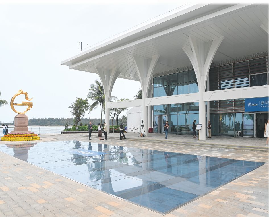
▲ 3月30日拍摄的博鳌亚洲论坛新闻中心门前的光伏地砖。