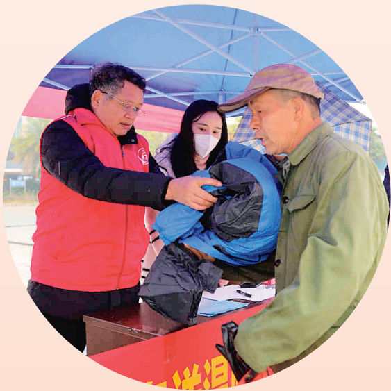
▲工作人员将御寒衣物送到衣着单薄的遇困群众手中。

放御寒衣物2件，提供食品6份，提供政策咨询和引导服务10余人，发放宣传资料、救助引导卡20余份。