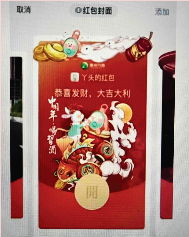
▲▼市民李女士的红包封面。

广西师范大学社会学社会工作专业副教授李昌阳表示，人都需要人际交往，随着疫情防控进入新阶段，人们面对面的交往更加多了，没有机会面对面交流的亲人、朋友则需要通过一些形式来促进彼此间的交流，微信红包加上一个特别的封面，其实是人与人之间想要更加亲密交流的体现。带封面的微信红包新颖、时尚，又能表达心意，不论是让对方开心还是为了让对方留下美好印象，其实都说明发红包的人想要与对方更加亲密的交流。李昌阳认为，人们交流、交往的形式一直在变，年轻人喜欢用直观、新鲜、时尚的东西来与人交流是一种好的趋势，因为这正说明了年轻人积极、开放的态度。