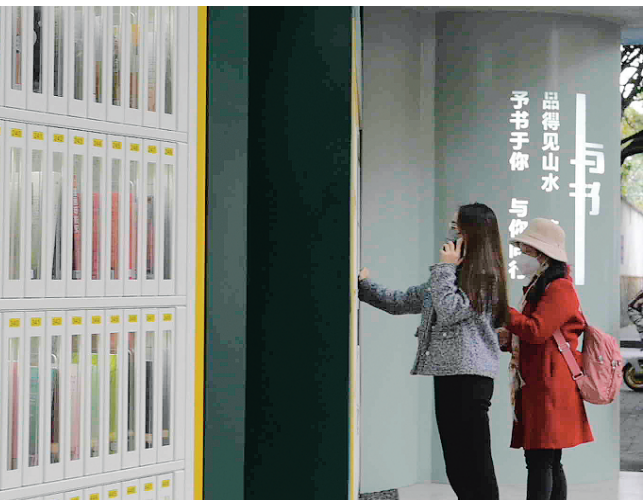
▲七星区在驛鸾路上新开设的 24 小时智慧阅读场所，市民前来借阅书籍。

本报讯 （记者韦莎妮娜 通讯员王亚东）“在家门口刷一刷身份证，就能随时借书、还书，方便得不得了哦！最重要的是，现在走到哪里都有浓厚的阅读氛围，新年我的计划就是多读几本书！”春节长假刚收假，位于驛鸾路 26 号的“微·书馆”前，几位市民自觉排着队借书、还书。60 岁的李莹一边赞叹不已，一边给记者展示她刚借出的《鲁迅全集》。