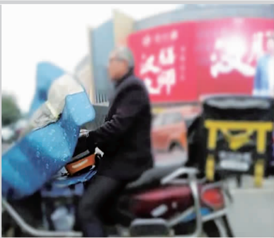
↑王先生虽然只有 54 岁，但头发几乎全白。

“有的给我小费；有的很温暖，叮嘱我下楼慢点，不要摔了；有的好心劝我，这么大年纪，不要送外卖了，回家享享福。”有一次，他在一家酒店送单，一个工作人员心疼他，给他泡了杯热茶，让他暖暖身子。他说：“我很感激他们，他们都是善良的人”。