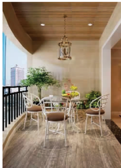
↑阳台改造成休闲区