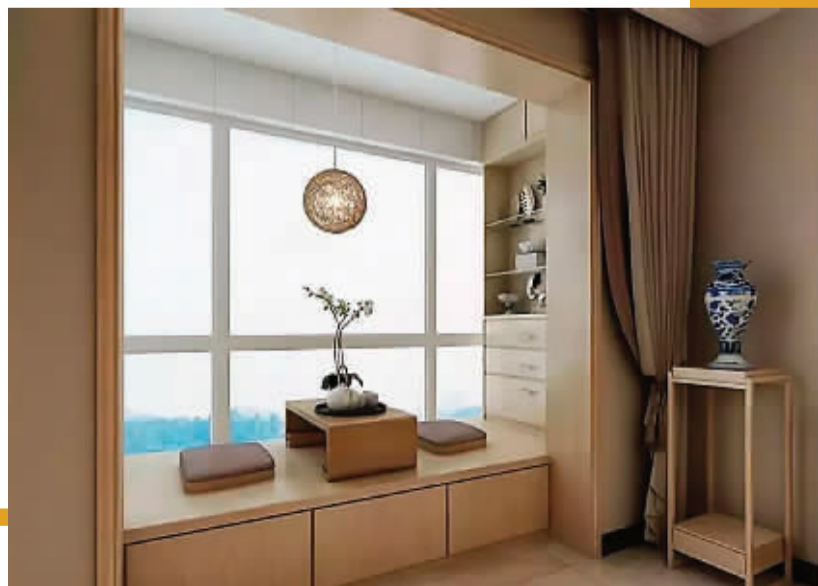
↑阳台改造成榻榻米