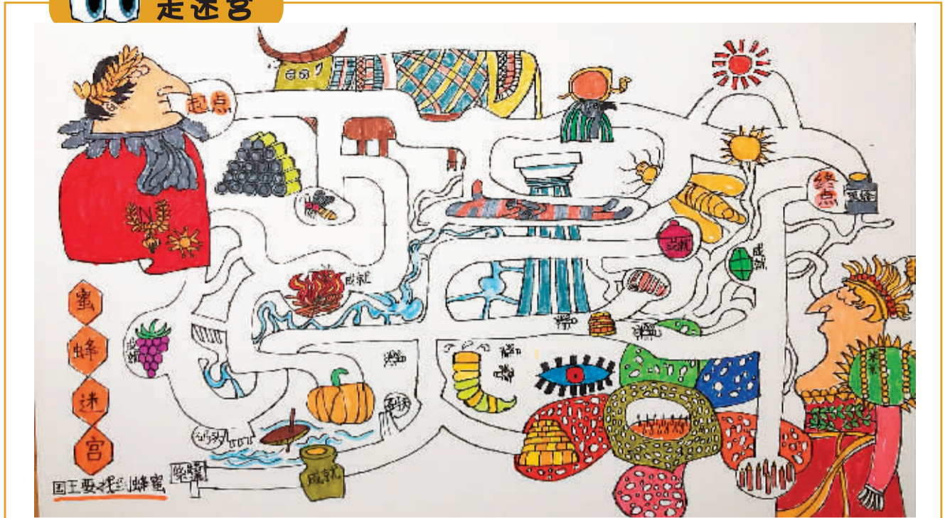
请帮助国王找到蜂蜜。