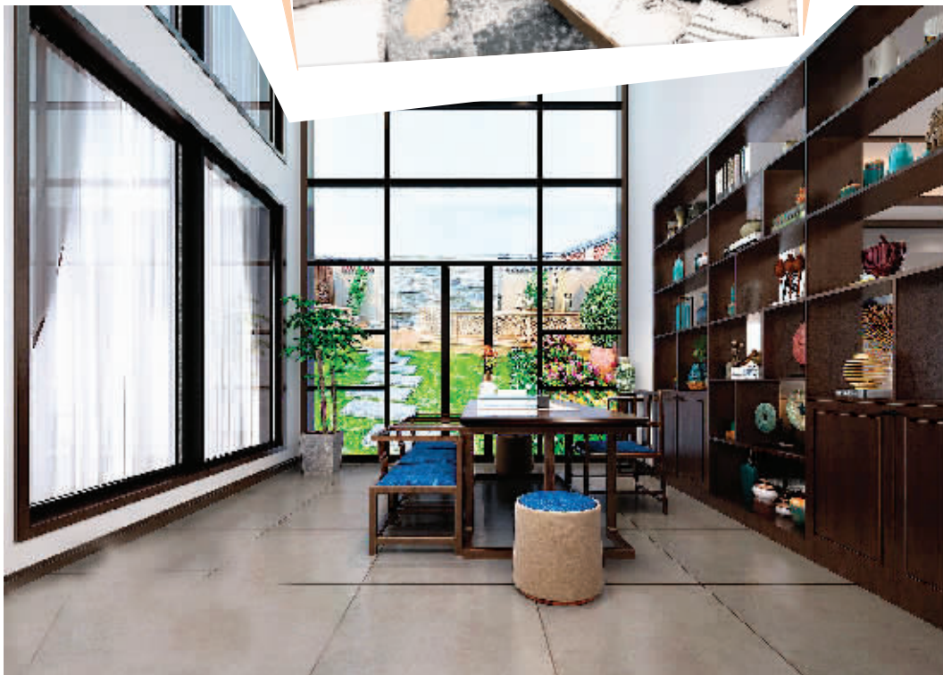
余杰设计作品: 《新中式风格》