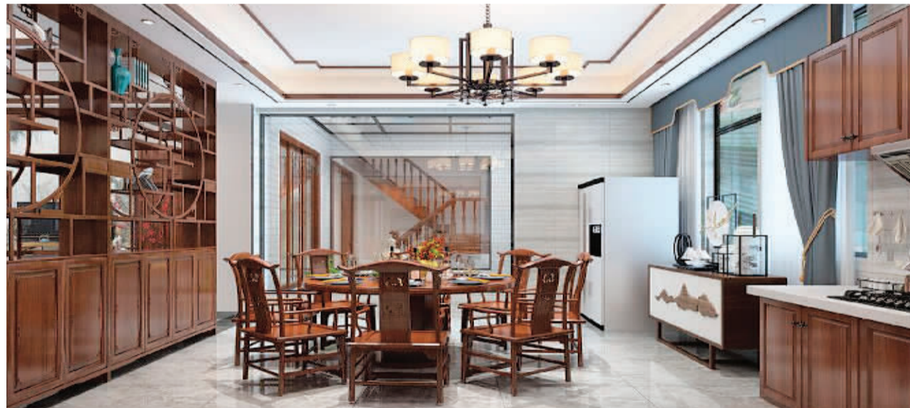
↑聂峰设计作品：《中式古典与现代简约》