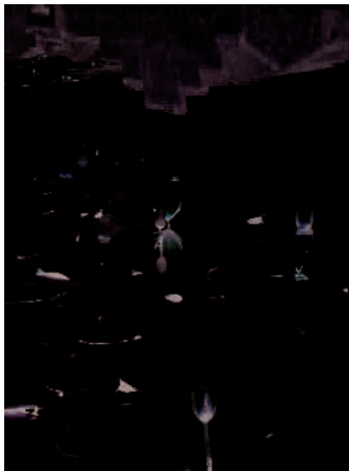
↑荷花与古宅屋顶的倒影相呼应，更显幽静和雅致。

来。直至今日，村中书画之风依然盛行，据我们的向导透露，村中成立画院的想法还得到政府的支持呢。